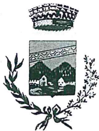
Comune di Colbordolo

Piazza IV Novembre n. 6 - 61022 VALLEFOGLIA (PU) C.F. e P.I. 02532230410