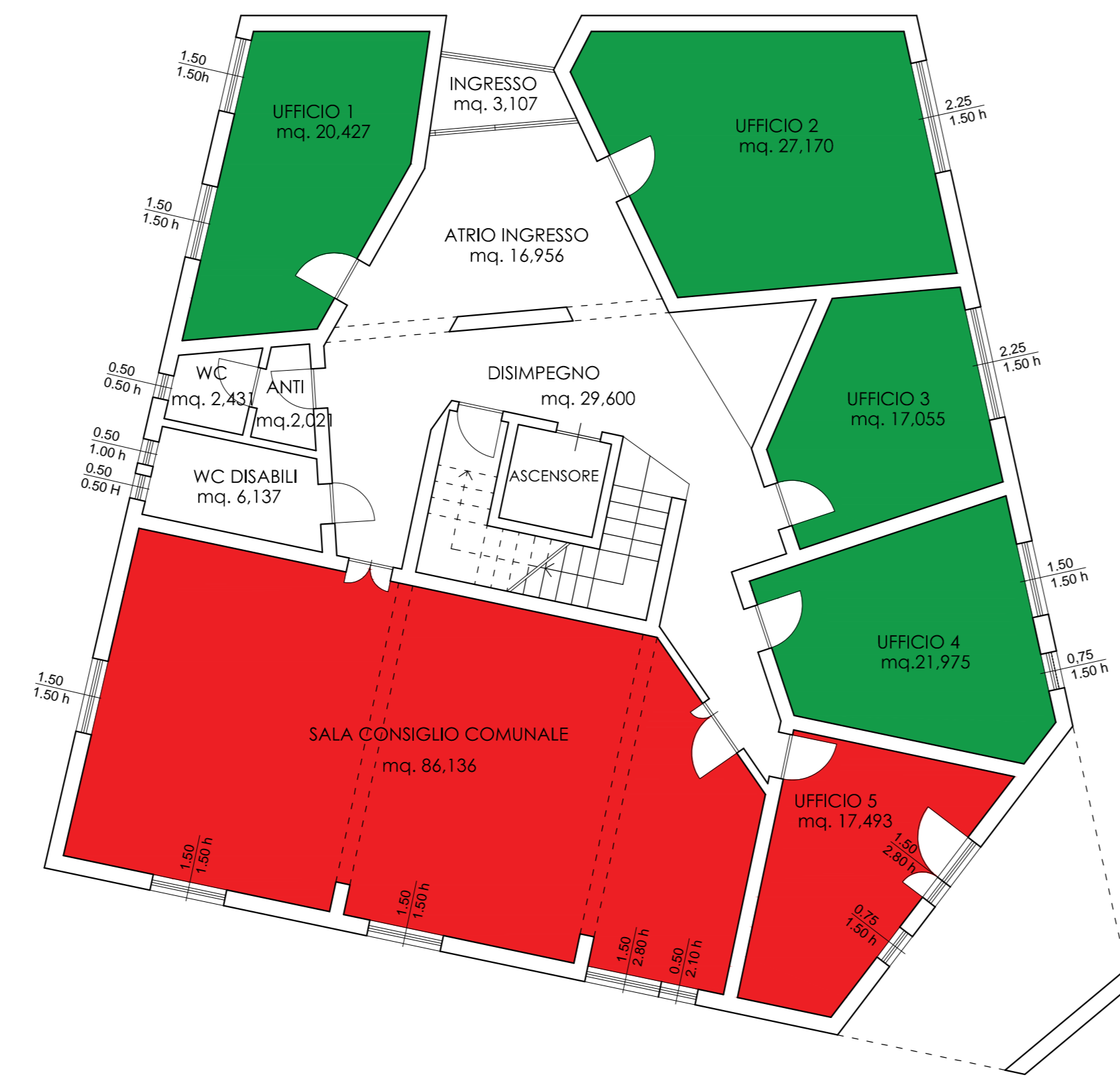
pianta piano terra