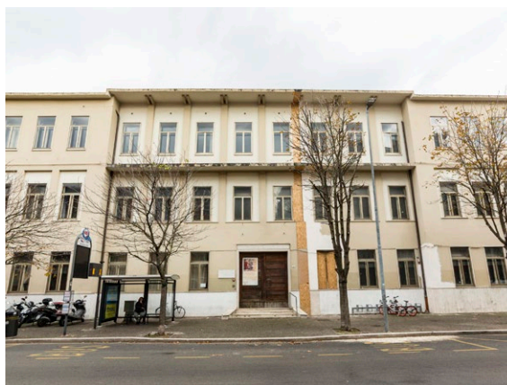
Liceo Mamiani Pesaro sede Morselli

Inizieranno nel 2019 i lavori per la messa in sicurezza dei solai e controsoffitti di 5 istituti superiori del territorio provinciale, per un importo di 3,8 milioni di euro stanziati dal Ministero dell'Istruzione, dell'Università e della Ricerca a favore della Provincia di Pesaro e Urbino. I progetti esecutivi sono in via di ultimazione e gli interventi riguarderanno il liceo artistico "Scuola del libro" di Urbino sede di via Bramante (1 milione di euro), l'Istituto "Olivetti" di Fano (450mila euro), l'Istituto "Mengaroni" di Pesaro (850mila euro), il liceo "Mamiani" di Pesaro sede Morselli (1,3 milioni di euro) e l'istituto "Cecchi" di Pesaro