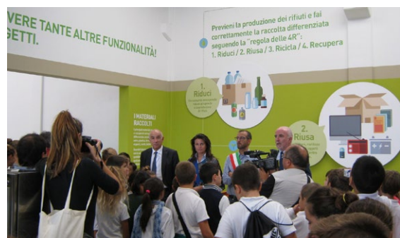
Inaugurazione Centro raccolta e Riuso a Pesaro