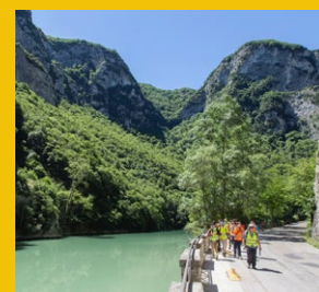
Escursionisti alla Riserva del Furlo