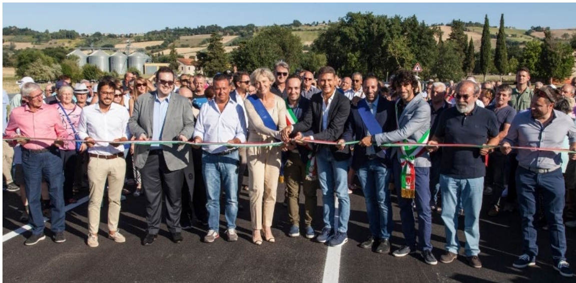
Inaugurazione Ponte sul Cesano