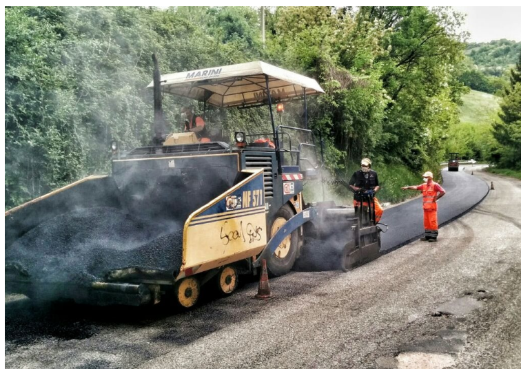
Lavori di bitumatura strade

Molti ci hanno provato, in pochi ci sono riusciti. Abbiamo restituito allo Stato la Flaminia, la Contessa, l'Urbinate, la strada Della Valcesano, più conosciuta come Cesanense. È stata trasferita alla Regione l'Apecchiese, assicurandole una gestione Anas. Abbiamo