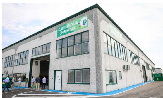
Centro di Raccolta a Colli al Metauro