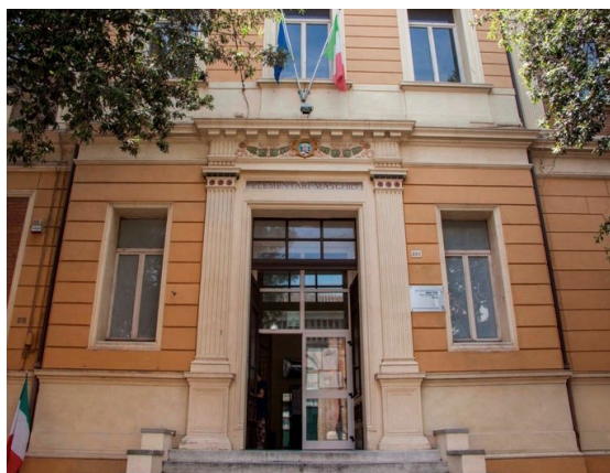
Liceo Mengaroni Pesaro