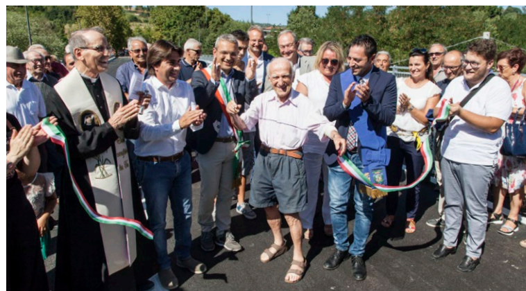
Inaugurazione Ponte dei Conciatori