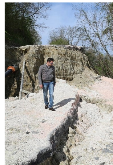
Sopralluogo Tagliolini frana Tavoletana