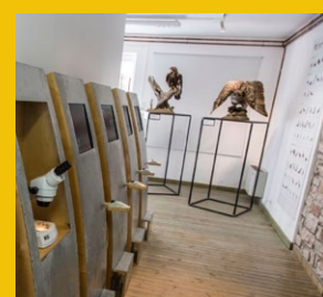
Museo del Territorio