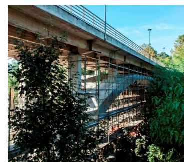
Cantiere Ponte Conciatori