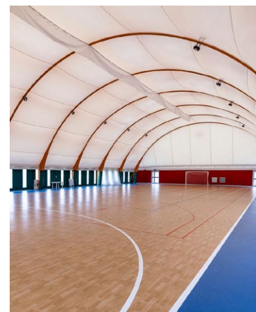
Struttura sportiva coperta Urbina