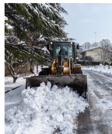
Mezzo sgombraneve in azione