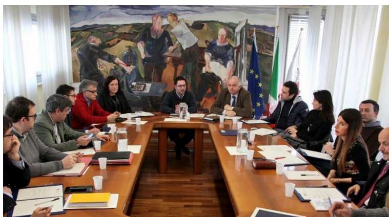
Una seduta del consiglio provinciale 2014 - 2016

La Provincia di Pesaro e Urbino ha attualmente le seguenti funzioni: gestione scuole superiori (edilizia scolastica, progettazione edifici scolastici, gestione e manutenzione immobili scolastici e servizi, programmazione rete scolastica, per un totale di 16.500 studenti e personale scolastico); viabilità, strade e trasporti (manutenzione e gestione 1200 km di strade e 311 ponti, con competenze anche su sfalcio erba ed emergenze maltempo, progettazione interventi su strade e ponti, gestione trasporti eccezionali, pronto intervento e servizi speciali in collaborazione con i Comuni); ambiente (tutela e valorizzazione, ciclo acqua, aria, rifiuti, rumore, controlli e autorizzazioni ambientali, pianificazione e programmazione ciclo rifiuti); pianificazione territoriale (gestione urbanistica dei 54 piani regolatori); assistenza enti locali, soprattutto attraverso il Centro Servizi Territoriale provinciale (informatica, reti telematiche e innovazione, raccolta ed elaborazione dati statistici, servizi gestionali, finanziari e contabili, giuridici e amministrativi, statistici); Stazione unica appaltante, con adesione ad oggi di 45 enti locali; pari opportunità (controllo dei fenomeni discriminatori in ambito occupazionale); organizzazione generale (tutte le attività che concorrono al funzionamento dell'ente); gestione Riserva naturale statale "Gola del Furlo". Ulteriori info: www.provincia.pu.it