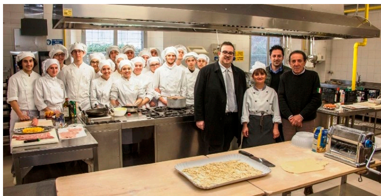
Inaugurazione alberghiero "Santa Marta" di Pesaro