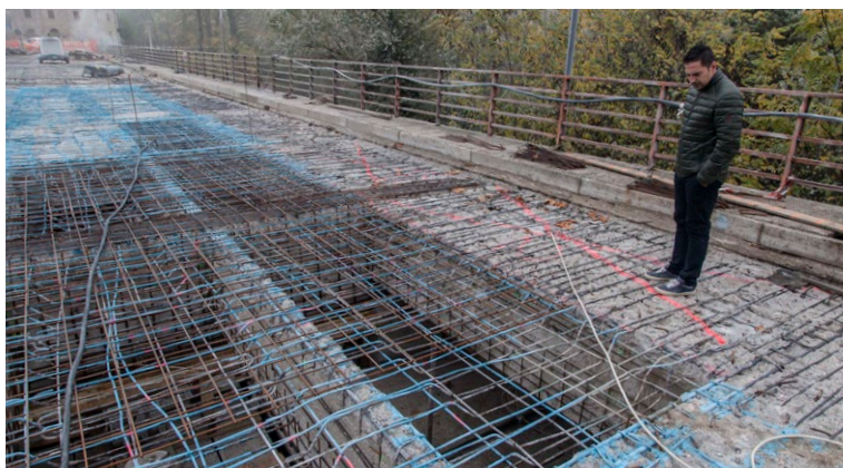
Lavori sul Ponte Conciatori