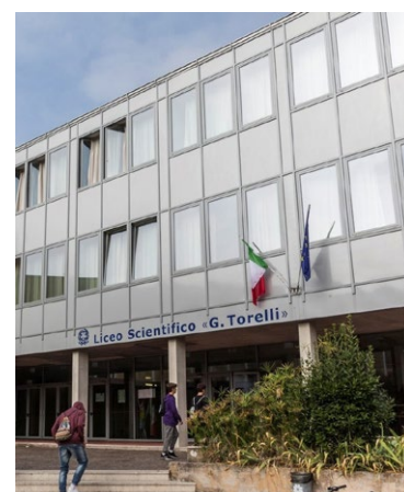
Istituto Torelli Fano

Assieme a dirigenti scolastici, studenti e Comuni, si stanno portando avanti progettualità che riguardano sia spazi bibliotecari che strutture sportive, servizi visti non solo come luoghi esclusivamente correlati all'istituto scolastico, ma come luoghi di incontro per i giovani della comunità e per la popolazione in generale. Progettualità in tal senso riguardano principalmente il Campus Scolastico di Pesaro per lo spazio biblioteca, mentre per le strutture sportive ci sono diverse scuole interessate. Urbina rappresenta la prima realtà che ha visto attuata questa specifica progettualità. Anche la sede di Cagli del "Celli", in collaborazione con il Comune, ha una specifica progettualità che riguarda una nuova struttura sportiva a servizio sia della scuola che delle associazioni del territorio.