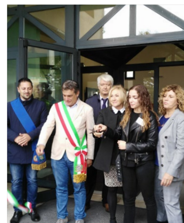
Inaugurazione Liceo "Apolloni" Fano