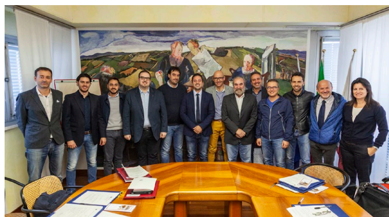
Tagliolini con i consiglieri provinciali eletti nel 2017