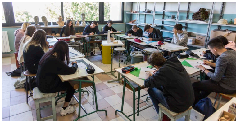
Laboratorio liceo "Apolloni" a San Lazzaro di Fano