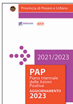
FIGURE E ORGANISMI

IL P. A. P. PIANO TRIENNALE DELLE AZIONI POSITIVE