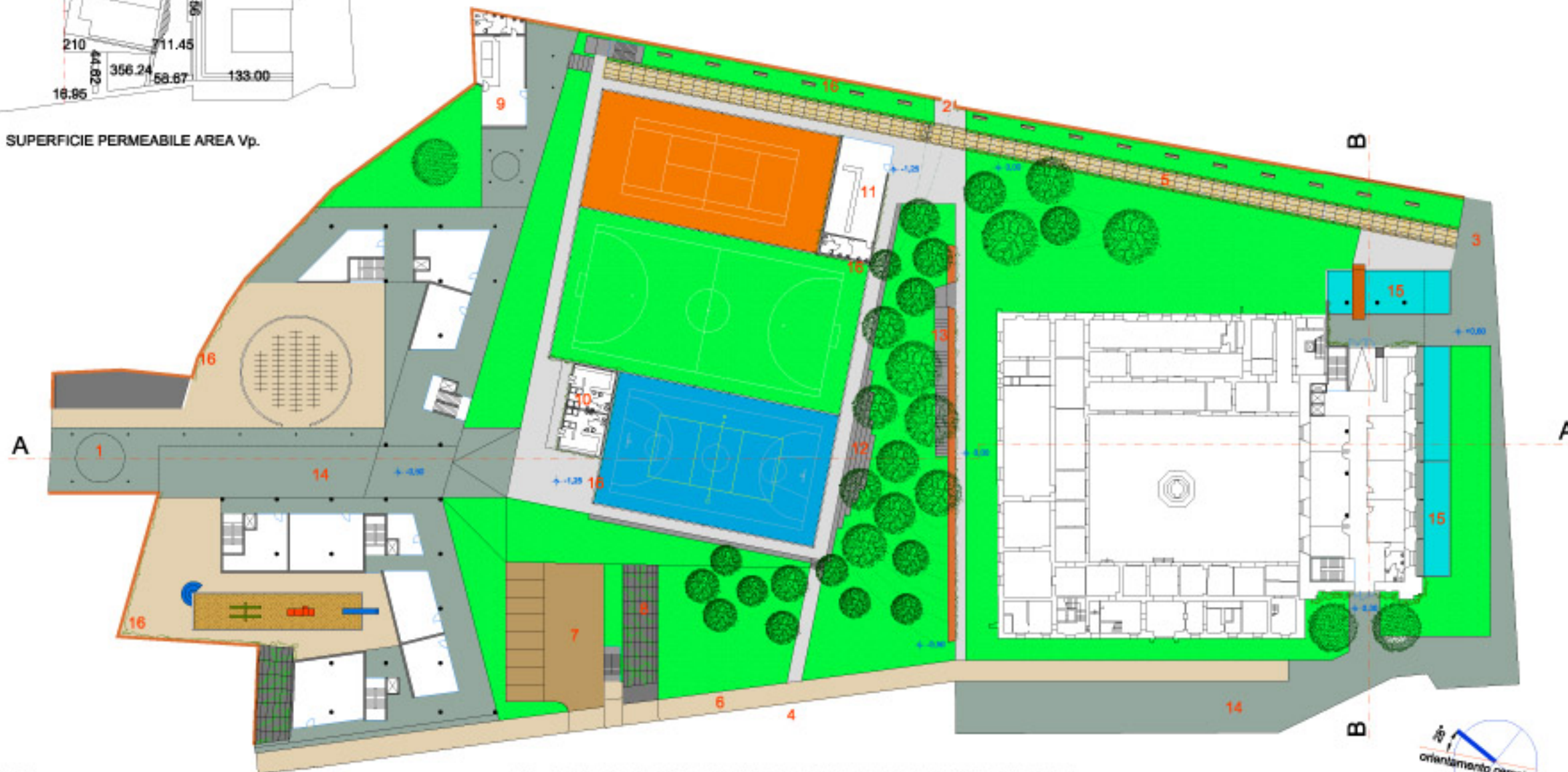
PLANIMETRIA GENERALE PIANO TERRA