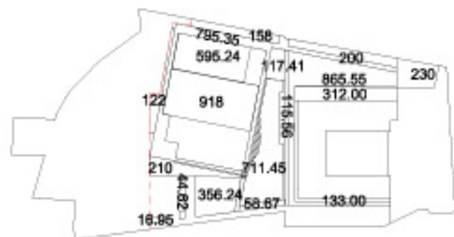
SUPERFICIE PERMEABILE AREA Vp.

della Vp. = 5960.04 > di 5026.70 mq. pari al 70% della Vp.