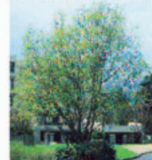
SALIX MATSUDANA "Tortuosa"