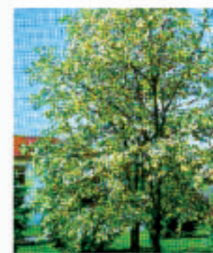
ROBINIA PSEUDOACACIA "Monophilla"