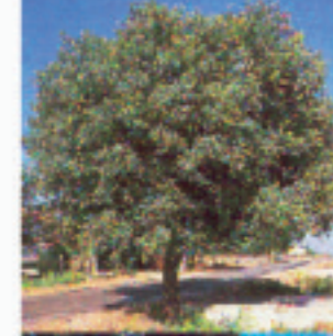
QUERCUS SUBER (Sughera)