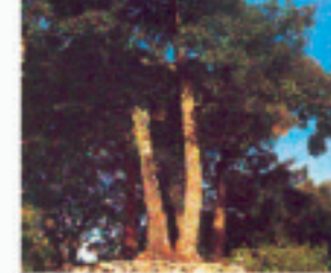
QUERCUS ILEX (Leccio)