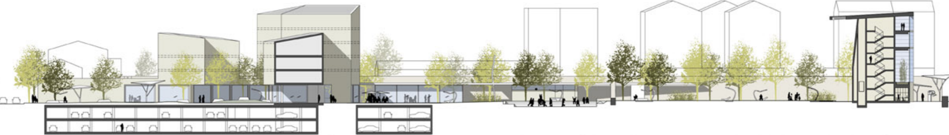
SEZIONE AA PARCO PUBBLICO 1:500