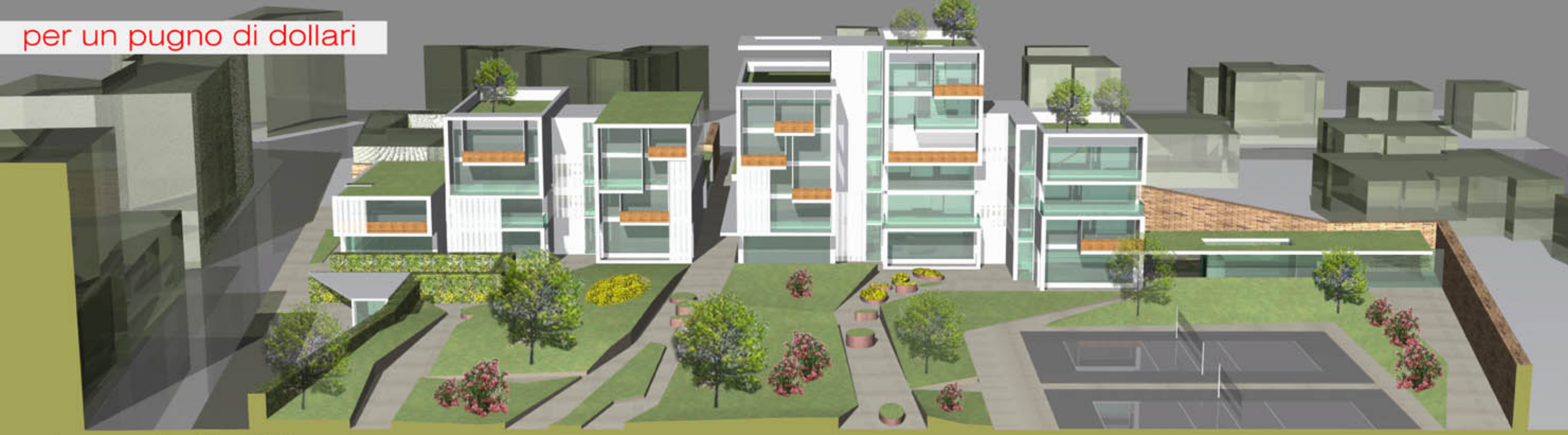
sezione prospettica A3 1/200