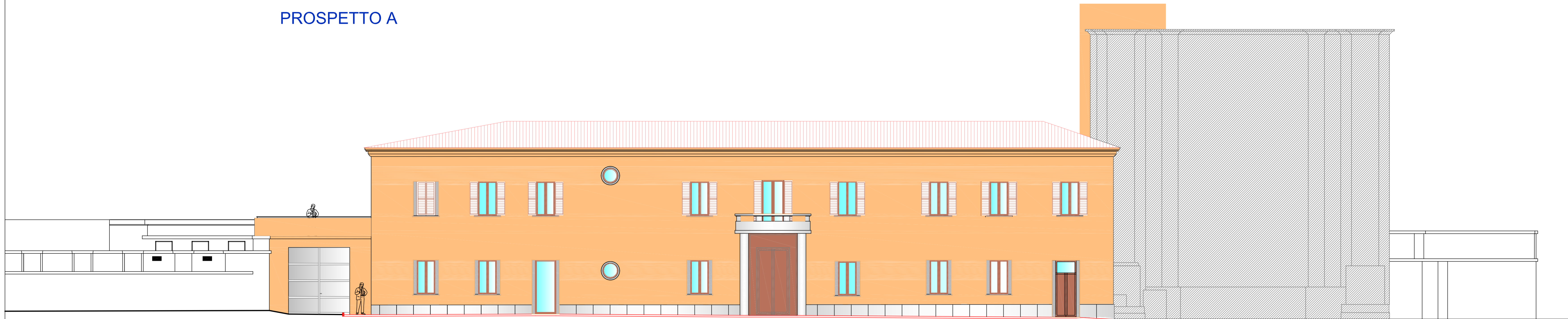
via Luca della Robbia