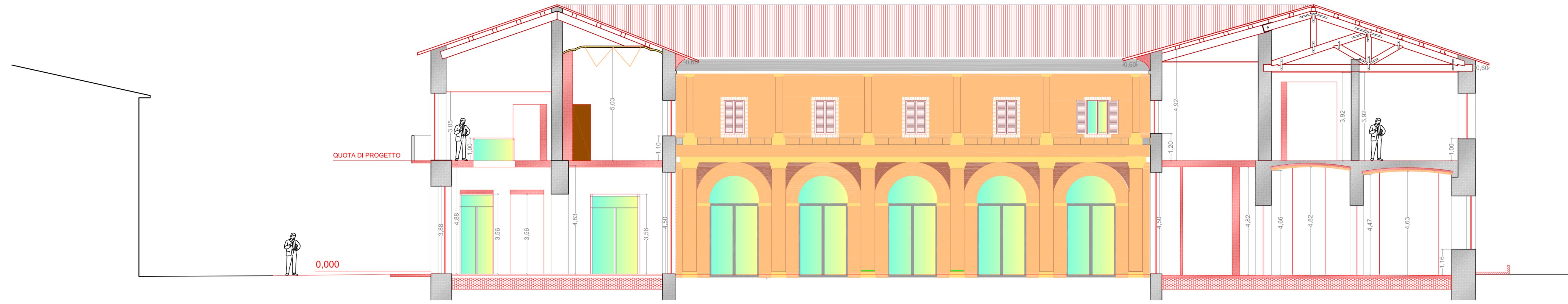
SEZIONE C-C PROSPETTO "b" DEL CHIOSTRO SEZIONE C-C