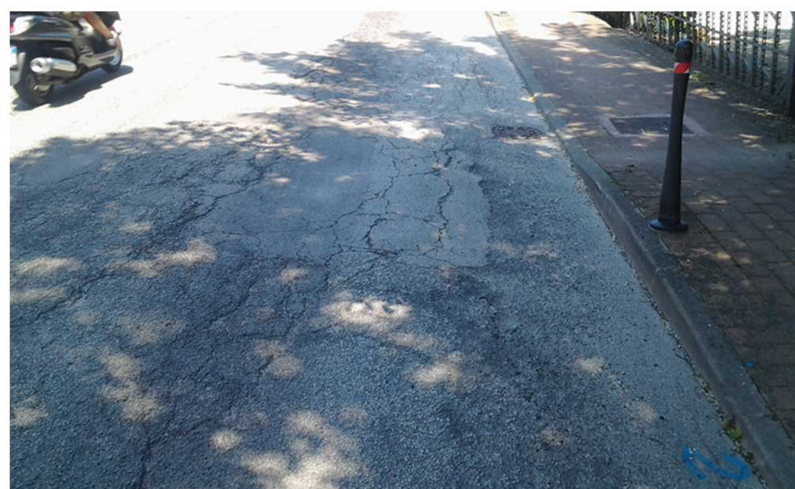
Prima dei lavori