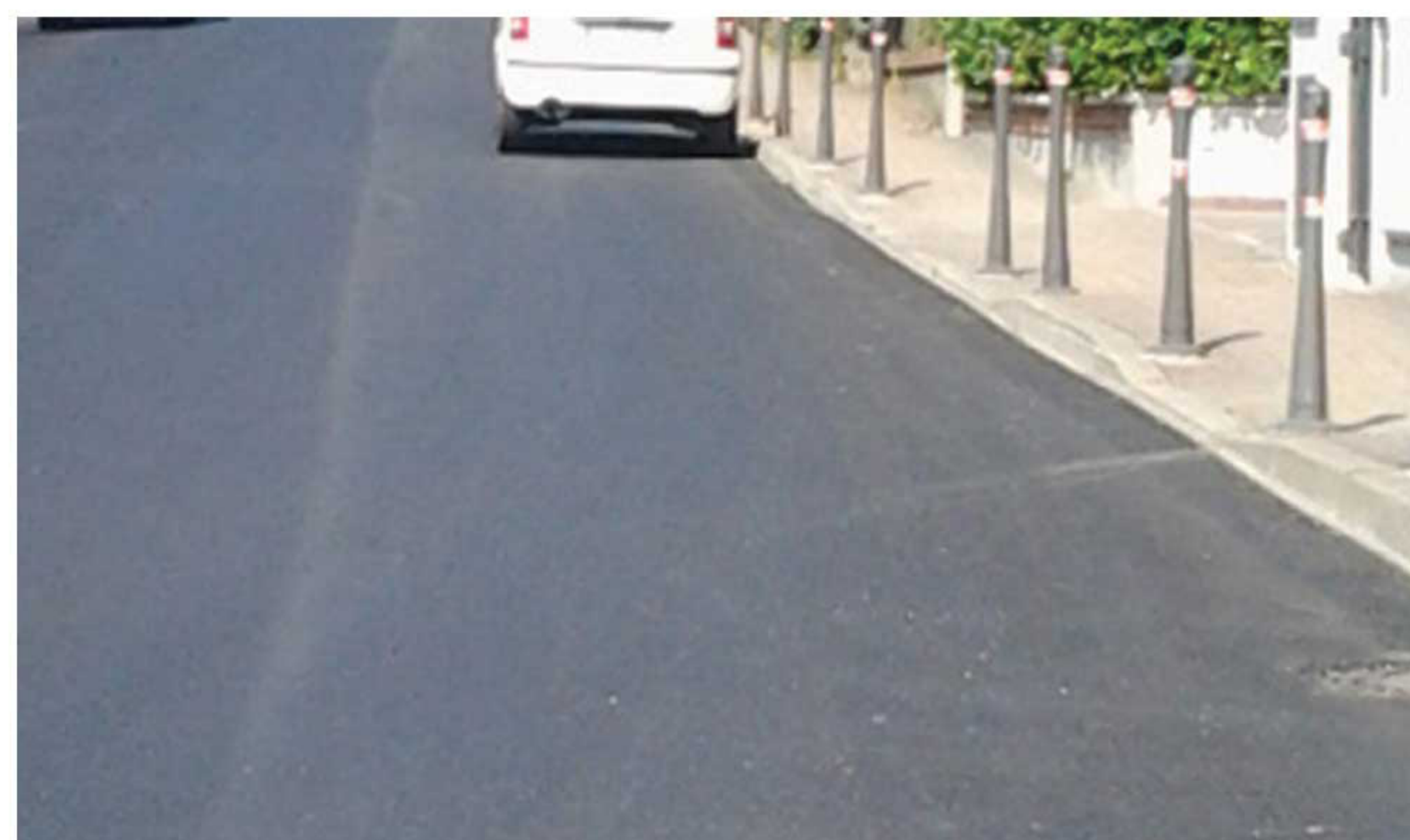
Dopo i lavori