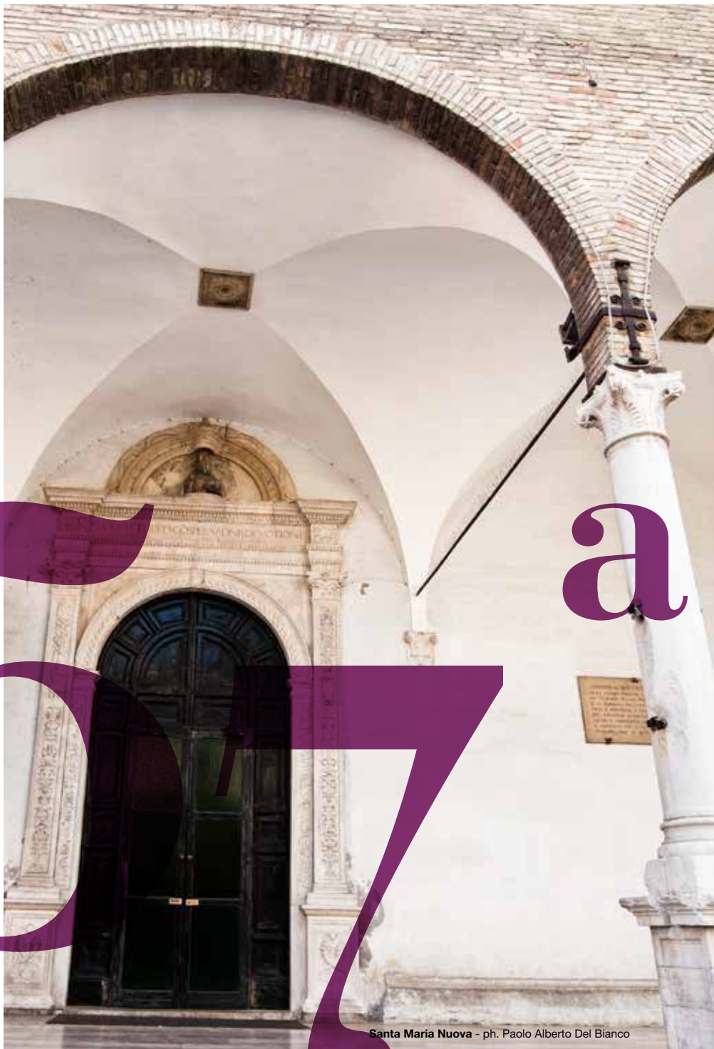
Santa Maria Nuova