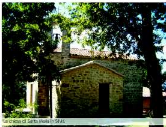
La chiesa di Santa Maria in Silvis

È luogo di paradiso, questo, ancora avvolto da una fitta vegetazione mantenuta ad arte da chi lo custodisce, meta spesso di ritiri in vista di comunioni e cresime.