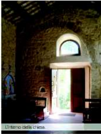
L'interno della chiesa.

Curiosamente questa chiesa, oggi come nel medioevo, non dipende dalla diocesi di Montefeltro , ma da quella di Rimini e questo poiché qui attorno si trovavano alcuni castelli di pertinenza Malatestiana , come il vicino di Valle Avdiana . Castelli che permettevano ai signori di Rimini di possedere uno stretto corridoio che dalla loro città