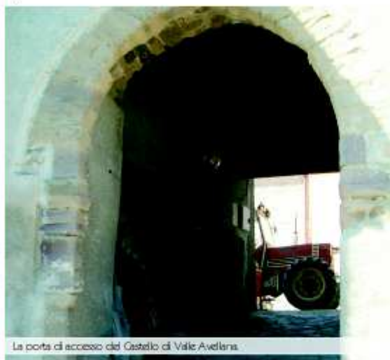
La porta di accesso del Castello di Valle Avellana.

Valle Avellana era un castello e qui, nel XIV secolo, vi risiedevano 24 famiglie. Il borghetto è densamente abitato, della sua antichità resta l'originaria porta d'accesso, al culmine di una rampa piuttosto ripida e lastricata con l'antico selciato. Questa è sormontata da un arco a sesto acuto, in arenaria: si trattava dell'ingresso del castello. Benché restino scarse tracce dell'originario circuito murario è perfettamente percepibile l'antichità di questo luogo tra le pietre delle sue abitazioni, edificate con murature scarpate e parecchio spesse e con finestre minuscole: sono case medievali. Valle Avellana è una frazione "tarda", è infatti approdata soltanto nel corso dell'800 in comune di Sassocovaro. Tra il '500 e l'800 appartene al vicariato di Tavolara , ad Auditore e a Macerata Feltria .