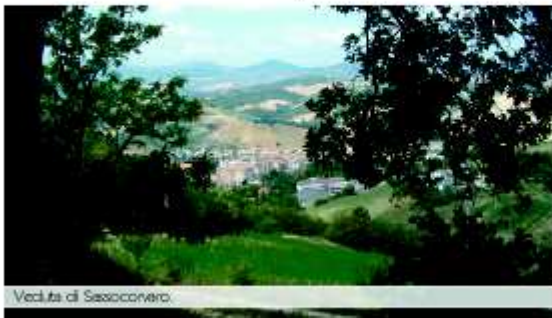
Veduta di Sassocevano.

Altri invece propendono per una ipotesi forse storicamente più credibile e vicina alle reliquie del pesarese. Di San Valentino ne esisteva uno soltanto (rendendo evidentemente impossibile la presenza di due santi martirizzati lo stesso giorno e sepolti sulla stessa via). Venne sepolto lungo la via Flaminia , presso Roma , dove sorgeva anche la sua basilica. Il suo culto, percorrendo la via Flaminia giunse fino a Terni e qui fu particolarmente sentita. La leggenda poi sdoppiò i santi e creò il santo di Terni . Mentre le reliquie di Sassocevano, provenienti da un cimitero paleocristiano, posto proprio alle porte di Roma , indicate come autentiche da eminenti personalità pontificie, che non avevano alcun interesse nel favorire la cittadina marchigiana, appaiono più credibili. Ma in fondo, Terni o Sassocevano, che importa... quando centinaia di innamorati, ogni anno, visitano entrambe le città con il cuore gonfio di sentimento, in cerca di una benedizione per la loro unione?