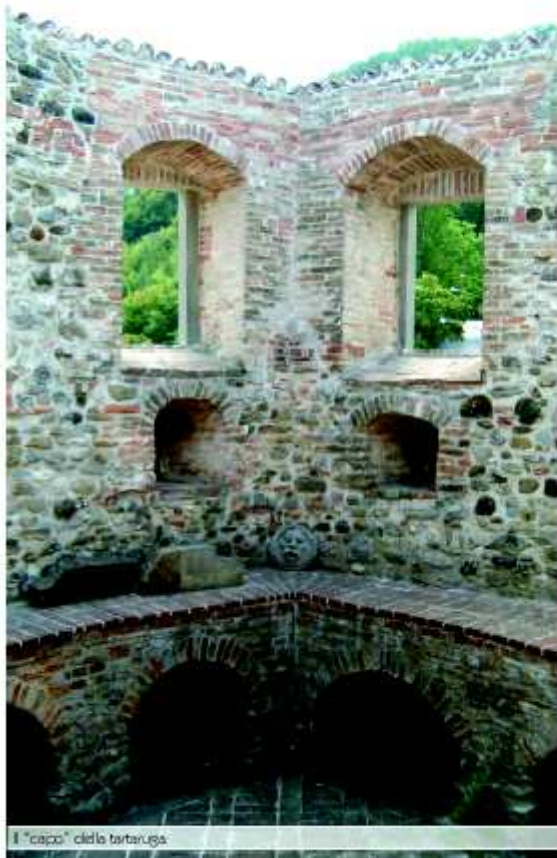
Il "capo" della tartaruga