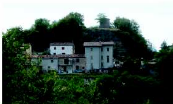
San Donato in Taviglione

San Donato , moderna frazione, densamente popolata, fu un castello importante, stato rilevabile ancor oggi dall'assetto del suo abitato e dello stesso roccione che sosteneva la fortificazione. La cima del colle appare infatti circondata dai ruderi delle antiche mura di cinta in arenaria, purtroppo in gran parte crollate. Il crollo riesce comunque a mostrare l'ordito della muratura, che altrimenti risulterebbe nascosto dal paramento esterno: un tessuto architettonico composto da alcuni costoloni che si appoggiano direttamente alla roccia del colle, conferendo stabilità alle strutture che vi si innestano. Dalla cima del poggio, raggiungibile a piedi da una ripida rampa, si può godere di un'ampia vista sulle vallate circostanti e su parte del Monfalcone .