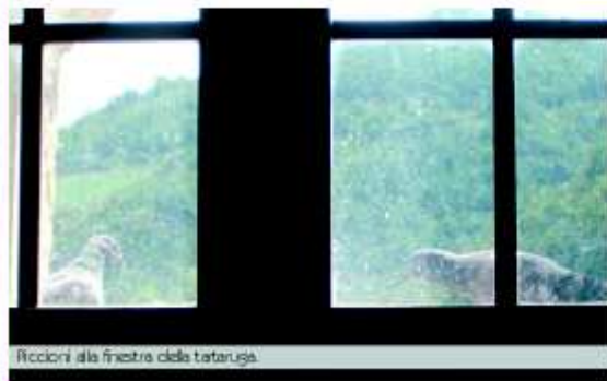
Riccioni alle finestre della tartaruga.