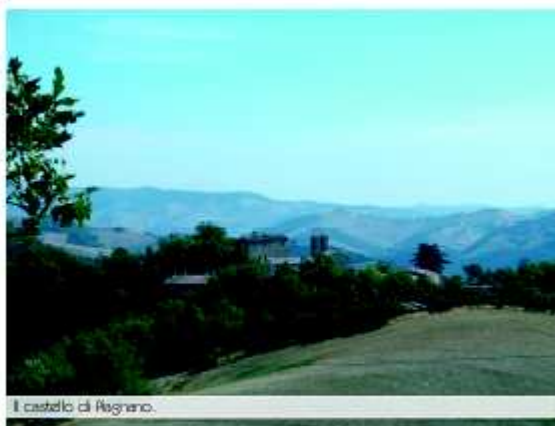
Il castello di Piagnano.

Risalendo la valle del fiume Foglia si può così giungere a Piagnano, posato su una collina a circa 400 metri s.l.m.