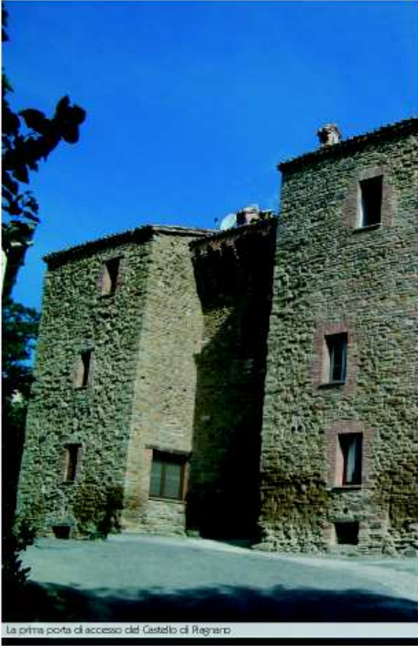
La prima porta di accesso del Castello di Regnano