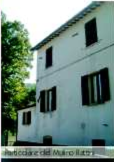
Particolare del Mulino Rattini

Nei pressi della frazione di Mercatale si trovano alcuni antichi edifici che, sebbene di proprietà privata e non visitabili, meritano comunque menzione per il loro valore storico ed architettonico. Poco fuori l'odierno abitato di Mercatale , si trova un grande edificio che fu un mulino: il Mulino Rattini . Si trattava di un mulino molto importante, al quale giungevano genti da tutto il contado; la struttura era dotata anche di una segheria che era azionata, dalla forza dell'acqua proveniente dal bottaccio. Tra le sue stanze conserva le originali macine.