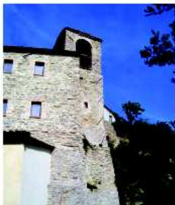
Il campanile della chiesa del castello

porte e finestre appaiono incorniciate da alcuni laterizi.