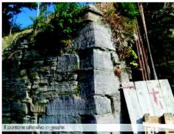
Il puntone difensivo in gessite.

Discendendo per il castello di Piagnano , uscendo dalla Porta Grande, svoltando verso sinistra, è impossibile non notare come, sulle mura di cinta, curiosamente crescano decine di piante di cappero meta degli abitanti della campagna, che qui vengono a rifornirsi del prelibato baccello. Nei pressi di questo tratto di mura si conserva ancora, sebbene piuttosto malconcio, un interessante puntone difensivo scarpato edificato con pietre in gessite perfettamente riquadrate.