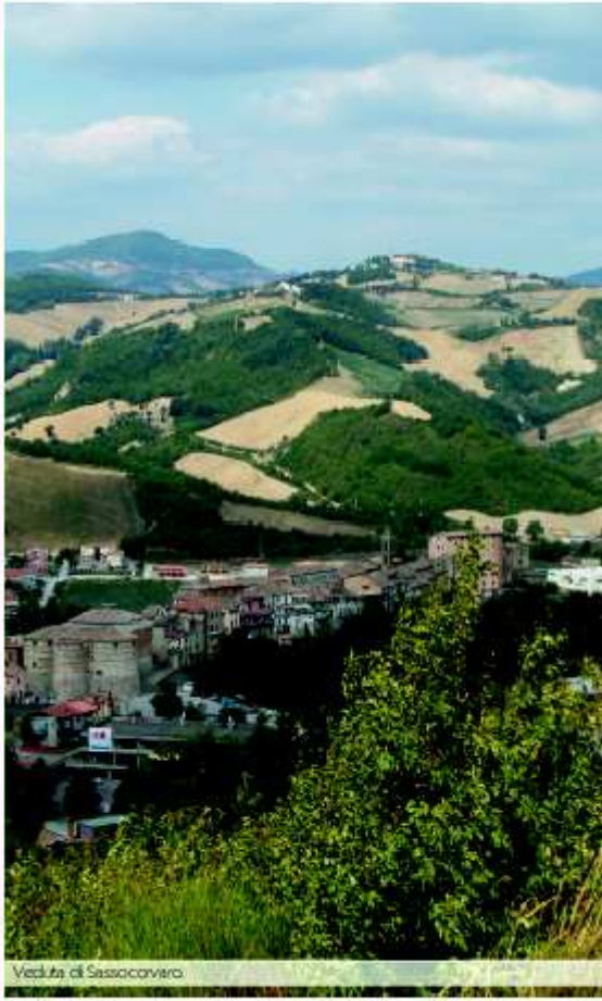
Vegeta di Sassocorvaro