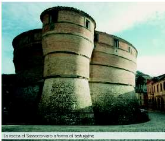
La rocca di Sassocorvaro a forma di testuggine.

Questa struttura non aveva bisogno di una difesa "dinamica" legata al paesaggio che la circonda, come accadeva per i castelli di Maiolo , Monte Copiolo e Pietrarubbia , sempre nel Montefeltro , quanto piuttosto di una salda staticità. Ma è l'epoca che ci mette lo zampino, questa rocca non fu concepita nel XII secolo, come le altre, ma in pieno '400.