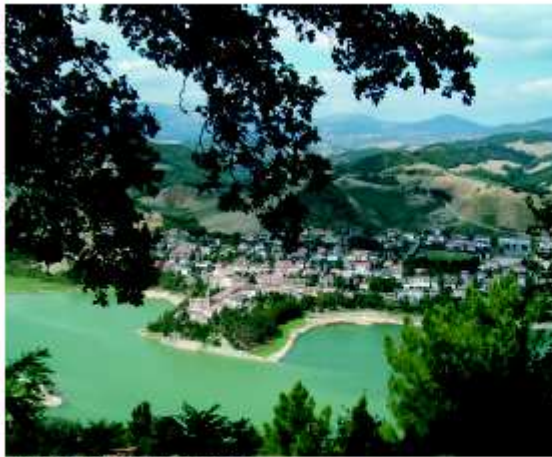
VEDUTA DI MERCABILE DAL COLLE PINCIA

Il paese sorge in posizione panoramica, di qui si può ammirare parte della sottostante vallata e salendo un poco alle spalle dell'abitato, sul colle Pincia , la diga diviene lago... con i suoi mille giochi di colore. Un paesaggio romantico che inamora.