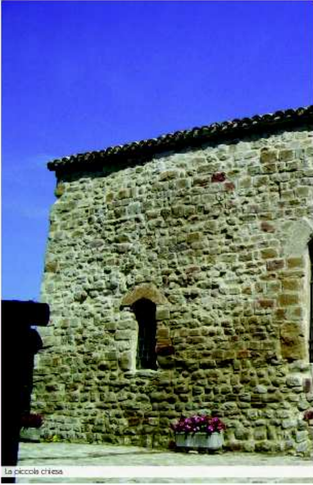
La piccola chiesa