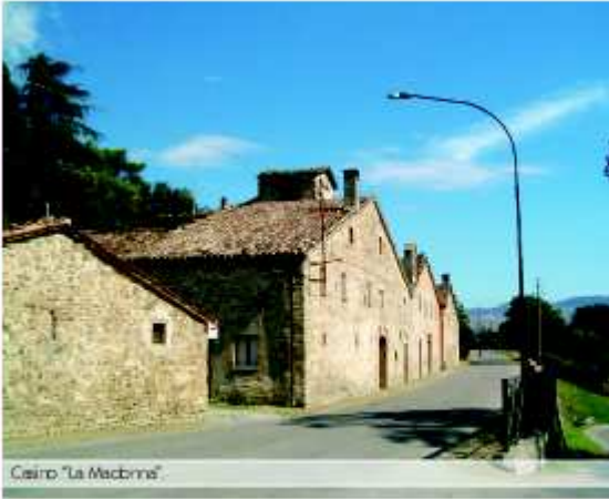
Casero "La Macchine"

Sempre restando nella frazione di Mercatale , questa volta però dalla parte opposta dell'abitato, verso Pesara , si trova una grande abitazione, dotata di tre tetti a capanna sormontati da una torretta, rassomigliante