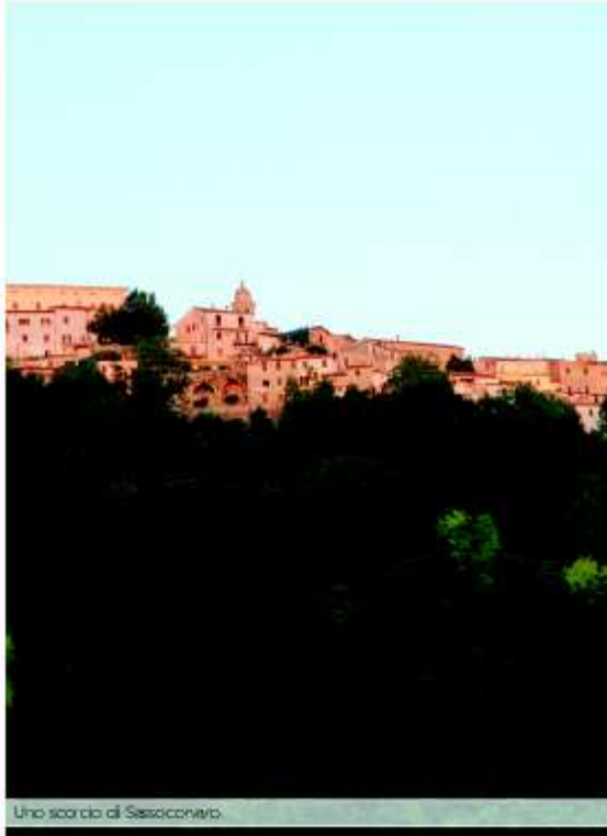
Uno scorcio di Sesocovero.

Non sono altro che tradizioni, perpetrate di generazione in generazione oralmente, che sebbene pittoresche meritano di essere fermate su carta e traghettate nell'era della modernità.