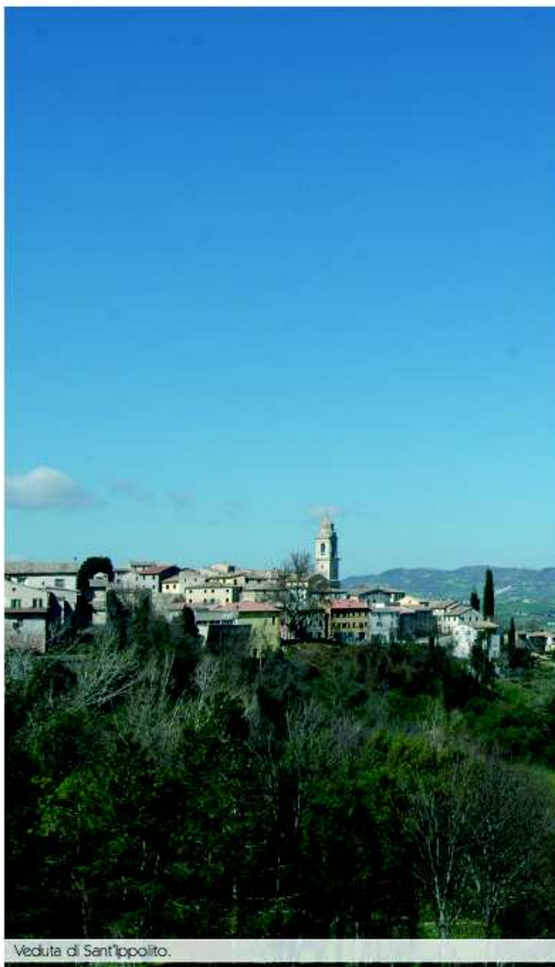
Veduta di Sant'ippolito.