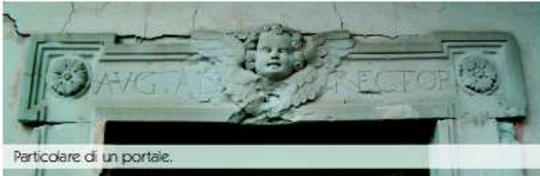
Particolare di un portale.

facciata. Chi, gironzolando per questi vicoli, riuscirà a contare più sculture e pietre lavorate, murate nelle abitazioni, sicuramente si aggiudicherà la palma di visitatore più attento e curioso.