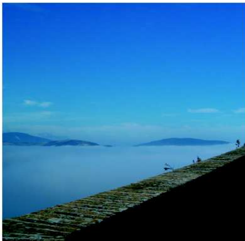
La Valmetauro nella nebbia del mattino vista dal giro delle mura.

D a Reforzate è scontato recarsi al castello di Sorbolongo (m 357 s.l.m.), altra storica frazione del comune di Sant'Ippolito . È un borgo "scomodo", più grande del capoluogo stesso, che sino al primo trentennio del secolo scorso era addirittura comune. Ed in effetti, appena entrati nel tessuto urbano, è possibile notare un edificio sormontato da un curioso campanile con orologio. Si tratta proprio della vecchia sede del comune. Sorbolongo è celebre per i suoi panorami. Dalle sue mura la vista può spaziare a 360° spingendosi sino alle estreme verticalizzazioni della provincia di Pesaro e Urbino .