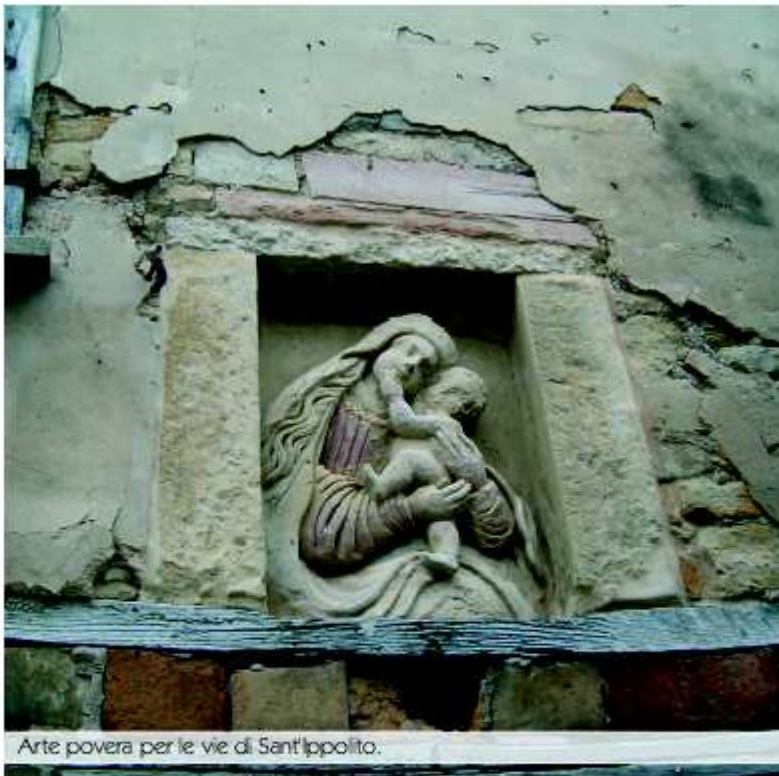
Arte povera per le vie di Sant'Ippolito.

Sant'Ippolito , e qui si svela l'arcano, è il paese degli scalpellini. Sin dai secoli medievali erano attive decine di botteghe di artigiani che lavoravano la pietra e questa tradizione, in parte, si conserva ancora