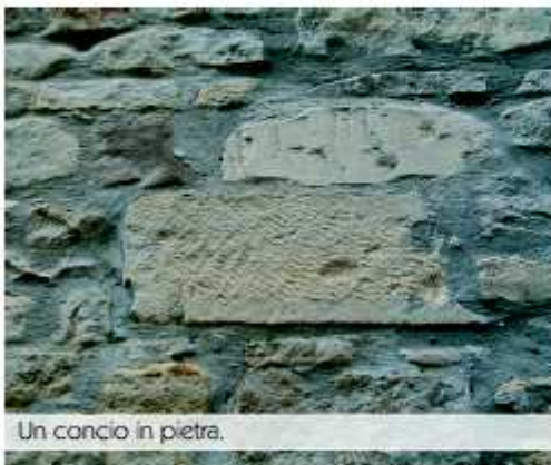
Un concio in pietra.

Proprio nei pressi della chiesa si trova uno dei portali più caratteristici dell'intero borgo (il portale della chiesa risale al primo trentennio del '900): si tratta del portale del Palazzo Michelangeli o Palazzo del Podestà . I due leoni in pietra che vegliano i tre sobri gradini e il prezioso portale sono posti a guardia del retrostante grande palazzo che fu sede del podestà cittadino quando Reforzate era castello indipendente non ancora aggregato a Sant'Ippolito .