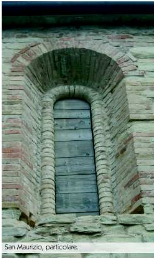
San Maurizio, particolare.

È il Monastero di San Maurizio , un antico complesso conventuale benedettino, situato a qualche metro dal cimitero cittadino. La struttura aveva controllo e pertinenze sui castelli di Reforzate , Sorbolongo e Villa del Monte e la leggenda narra che, in questo luogo, prima del convento, si trovasse un tempio pagano dal culto sconosciuto. All'interno della chiesa, in una piccola nicchia scoperta del tutto casualmente dopo un crollo avvenuto durante un temporale, si conserva un affresco