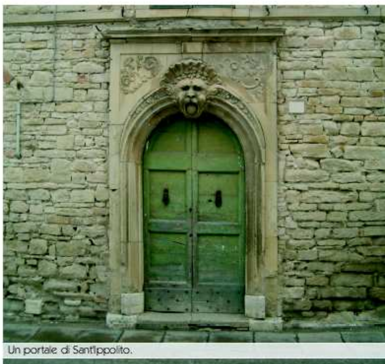
Un portale di Sant'Ippolito.

Sant'Ippolito non è affatto un piccolo centro, ma una dignitosa cittadina avvolta nelle sue mura di arenaria. Qui tutto è arenaria: dai