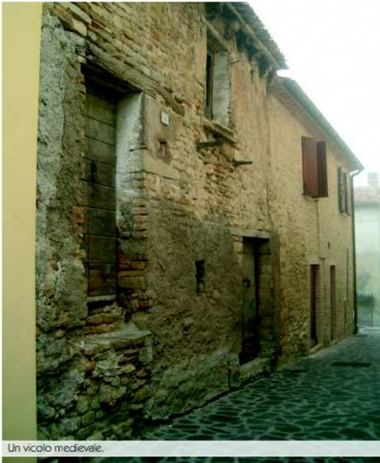
Un vicolo medievale.

È prezioso Reforzate al pari di Sant'Ippolito e forse anche più. Qui veramente gli scalpellini si sono dati da fare, involontariamente, per rendere il castello un piccolo gioiello non in pietra preziosa, ma più generalmente in pietra... una pietra gialla e friabile che però grazie ad una accurata lavorazione sospesa tra l'artigiano e l'artista è divenuta opera d'arte povera.