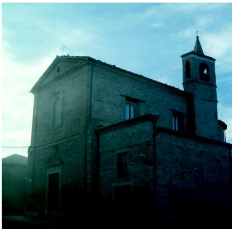
Chiesa di San Michele di Sorbolongo.

Questo castello, proprio per la sua posizione interamente accoccolata sulla cima della collina chiusa dalle mura, pare