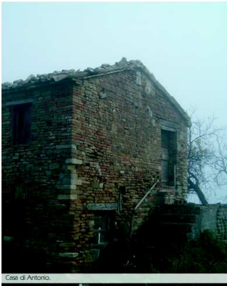
Casa di Antonio.

Senza cedere alla tentazione di scendere subito per queste vie conviene proseguire, alla destra della chiesa, il giro delle mura. Con le mura pare infatti che giri anche il paesaggio che si trova attorno a questo centro, letteralmente sospeso sulla valle del fiume Metauro . Costeggiando le mura si giunge a transitare alle spalle del grande abside della parrocchiale, forse il simbolo principale dell'intera frazione.