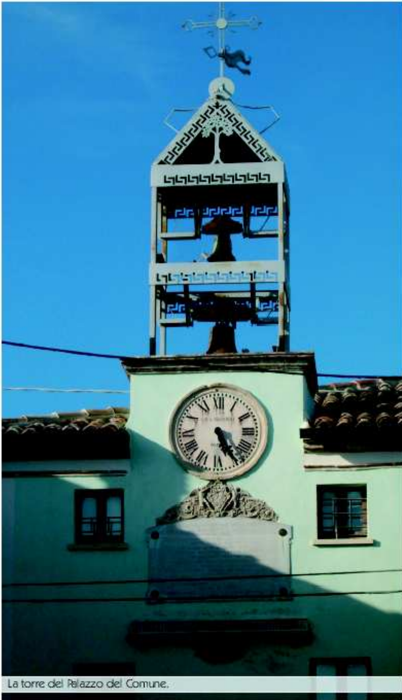
La torre del Palazzo del Comune.