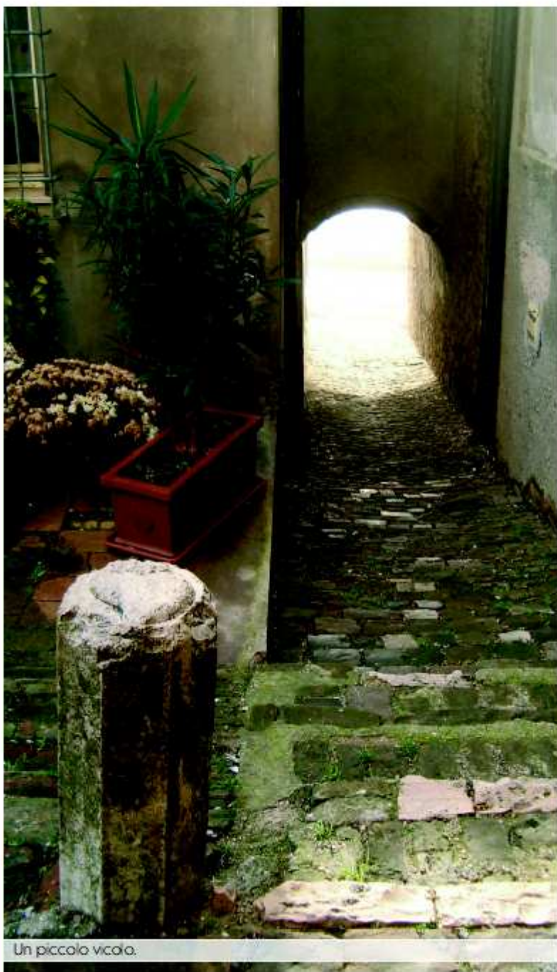
Un piccolo vicolo.