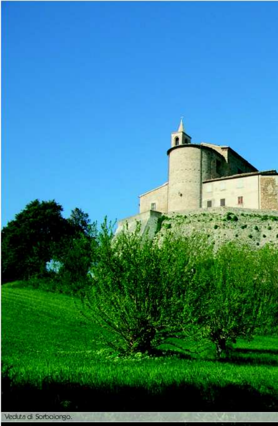
Veduta di Sorbolongo.