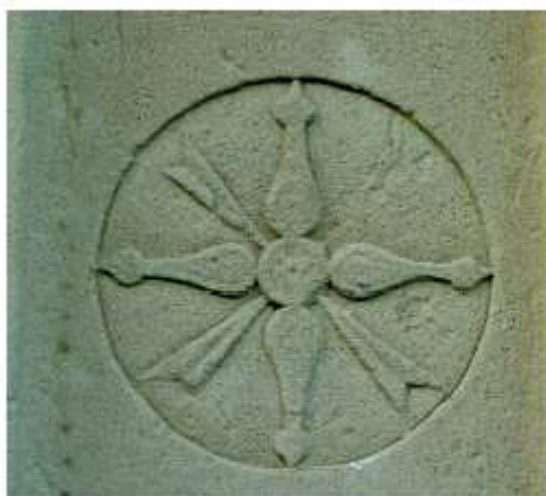
Particolare della chiesa.

La veduta più famosa di questo borgo è forse quella che si gode quando, salendo da Reforzate , il castello con l'alta chiesa di San Michele appare troneggiare sopra il suo poggio.