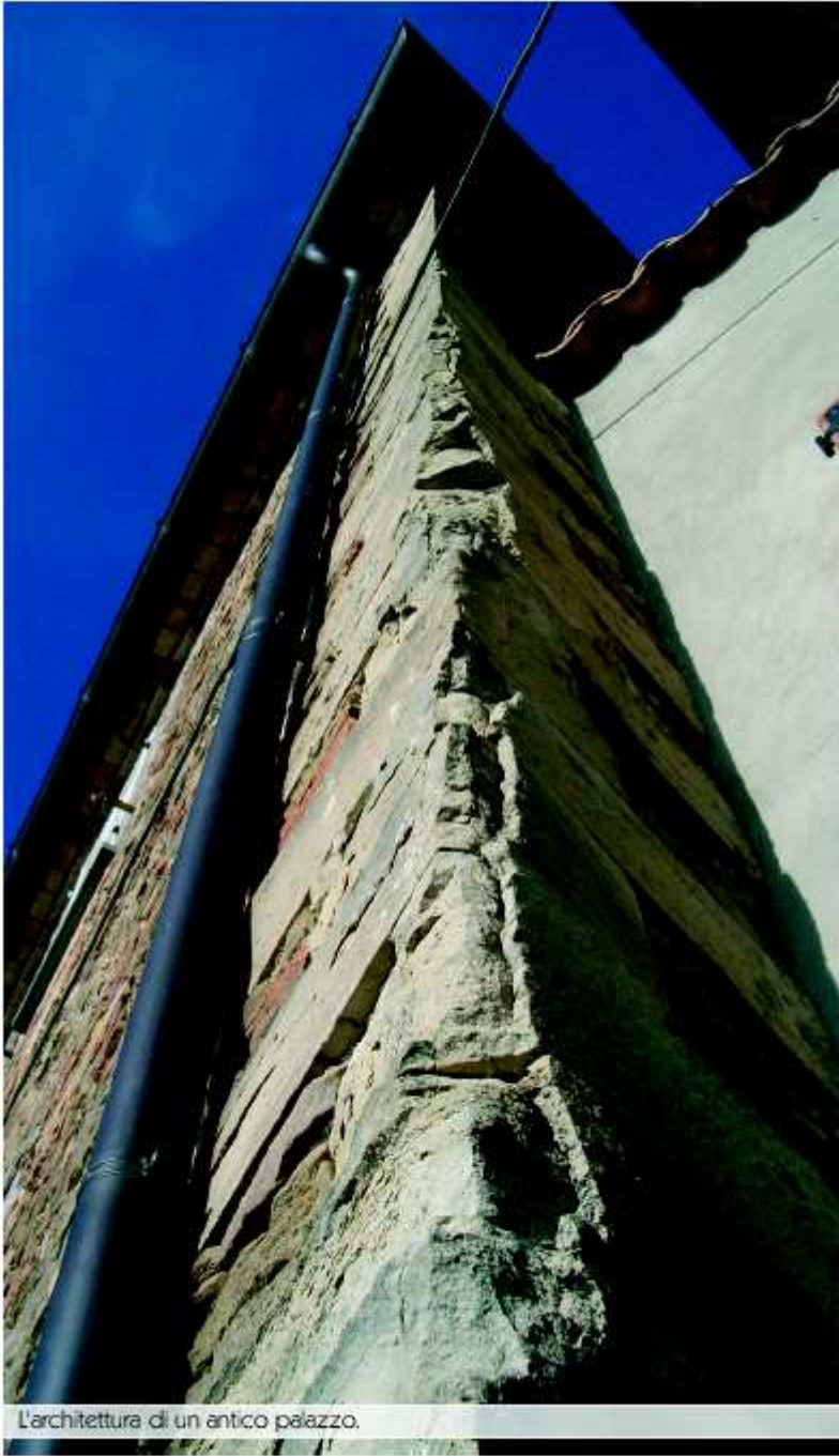
L'architettura di un antico palazzo.