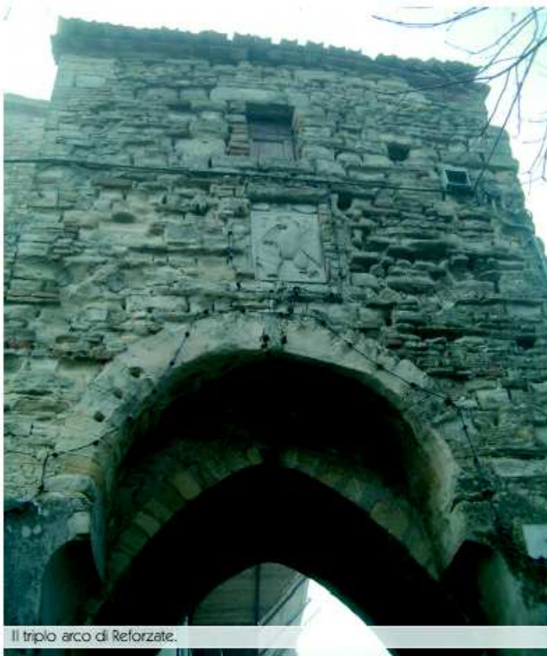
Il triplo arco di Reforzate.

L'abitato è stretto all'interno delle mura che, in parte, sono originali, edificate in pietra arenaria come il resto del paese. È possibile