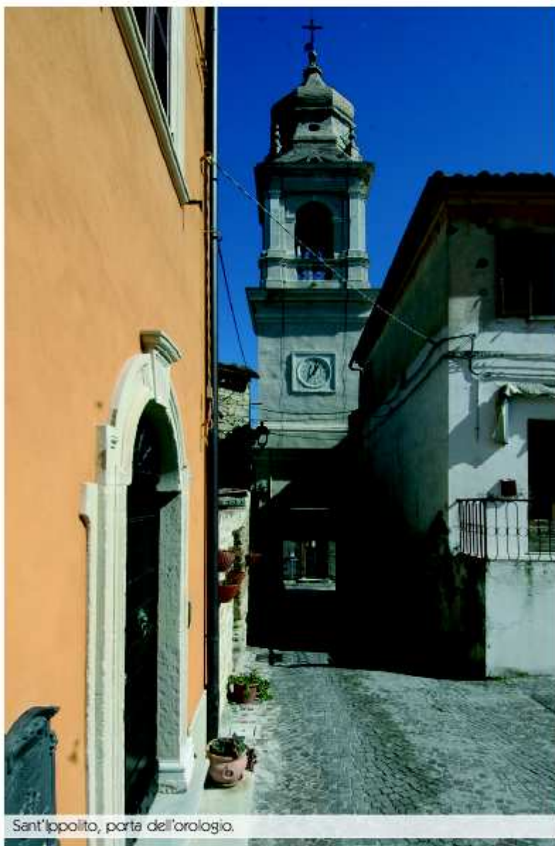
Sant'Ippolito, porta dell'orologio.

oggi. Ovunque sbucano segni di questa peculiarità che ha inciso e modellato chili e chili di pietra arenaria, un sasso giallino e spesso friabile, dal quale escono splendidi fregi per portali, ma anche robusti conci per murature.