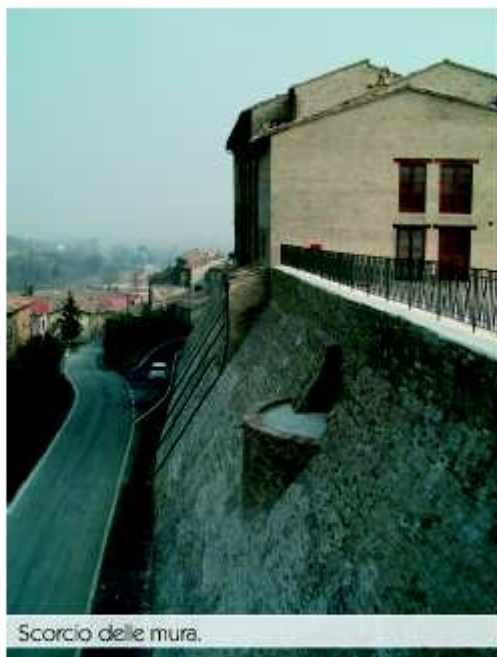
Scorcio delle mura.

San Lorenzo non è soltanto il suo capoluogo ed allora nel territorio comunale, oltre ai mulini, si incontrano frazioni ricche di storia, sospese a cavallo di suggestivi panorami che ricordano certi acquerelli del pittore