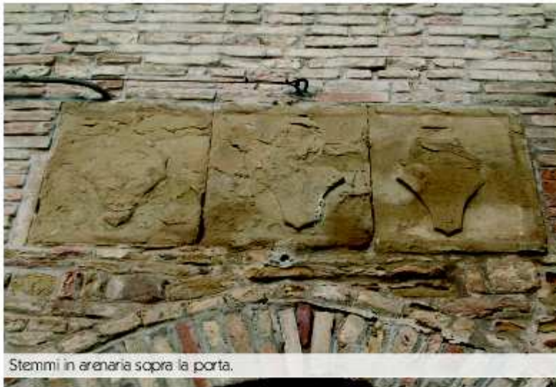
Stemmi in arenaria sopra la porta.

È un gioco visitare questo luogo. Diverse vie sono strette, spesso dei ballatoi collegano i due fronti delle abitazioni, come accadeva frequentemente nel medioevo. È una caccia al "portale" San Vito . Ci si può mettere d'accordo allora, in due o tre, e decidere di iniziare una gara. Un primo può scegliere i portali con arco a tutto sesto, dunque romanici, un secondo quelli a sesto acuto, dunque gotici ed un terzo