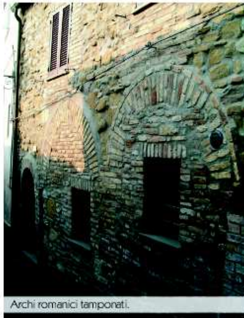
Archi romanici tamponati.

Di qui si gode una vista del castello e delle sue difese.