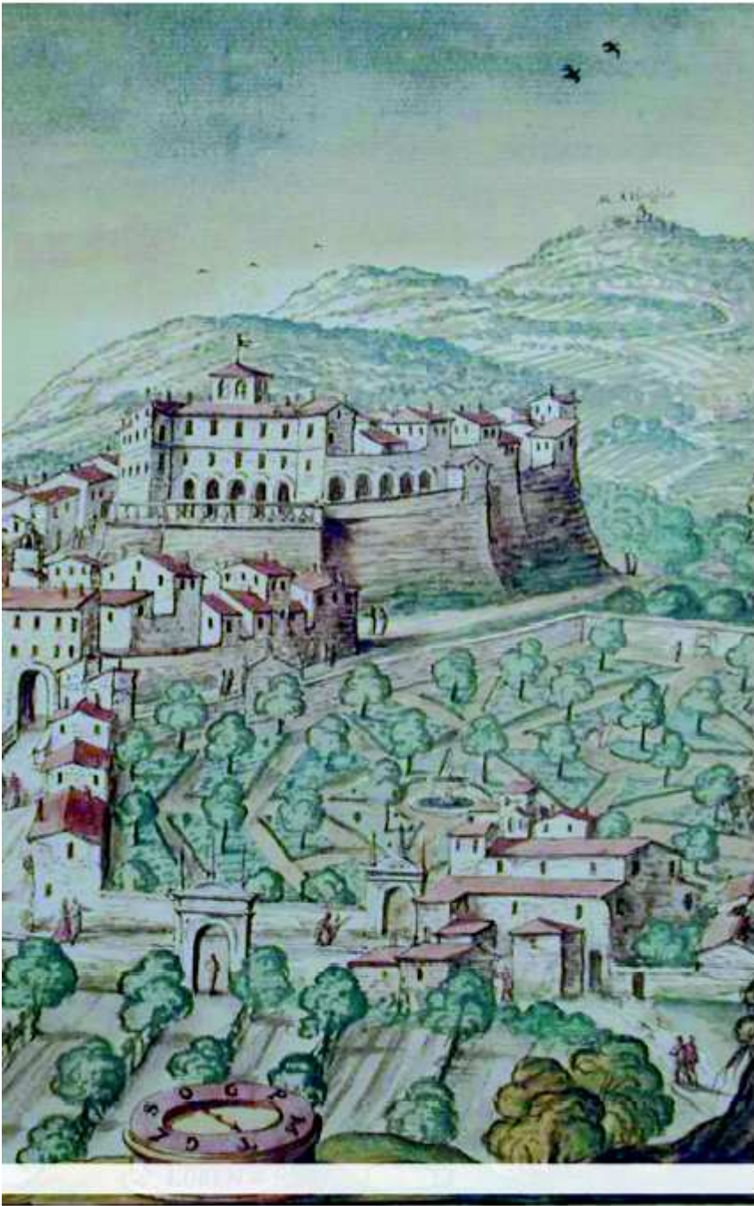
San Lorenzo in Campo