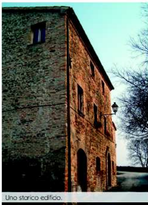
Uno storico edificio.

Da San Lorenzo si sale alla volta di Montalòglio un castello misto, di sabbia e terracotta. È edificato in parte, infatti, anche con pietre di arenaria. Pietra di fiume, dunque, giallognola e spesso friabile. Il suo ingresso è molto simile a quello del castello di Sant'Andrea di Suasa . La