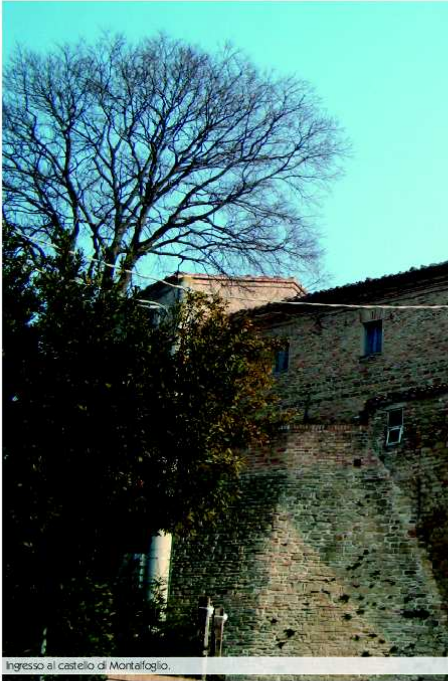
Ingresso al castello di Montafoglio.