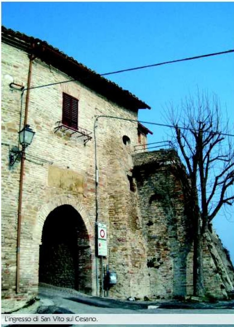
L'ingresso di San Vito sul Cesano.

Uscendo dalle mura ed imboccando una strada bianca che si trova appena oltre la porta, nei pressi di un vecchio lavatoio, è possibile diri-