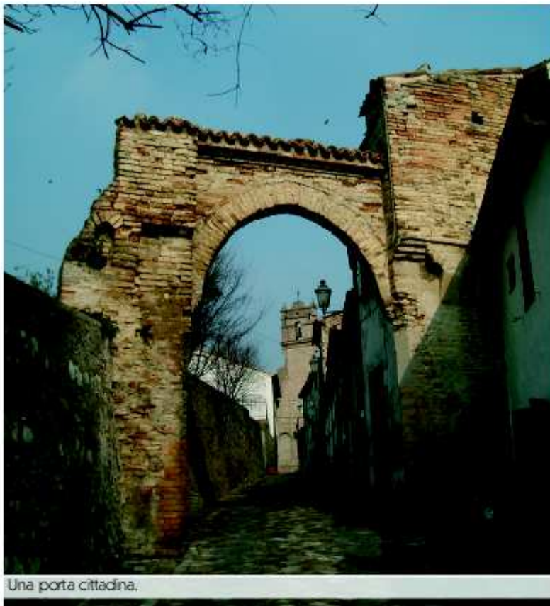
Una porta cittadina.

San Vito sul Cesano , il paese degli archi, ruzzolante giù per la sua discesa che ogni cosa lascia scivolare oltre l'arco gotico d'ingresso aperto sulle campagne, oggi come ottocento anni fa. Terra di mulini, questa, tanti un tempo e schierati lungo il corso del Cesano come cercatori di pagliuzze d'oro. Una terra emozionante, sospesa tra romanità e medioevo, tra un passato prepotente ed un futuro che incalza.