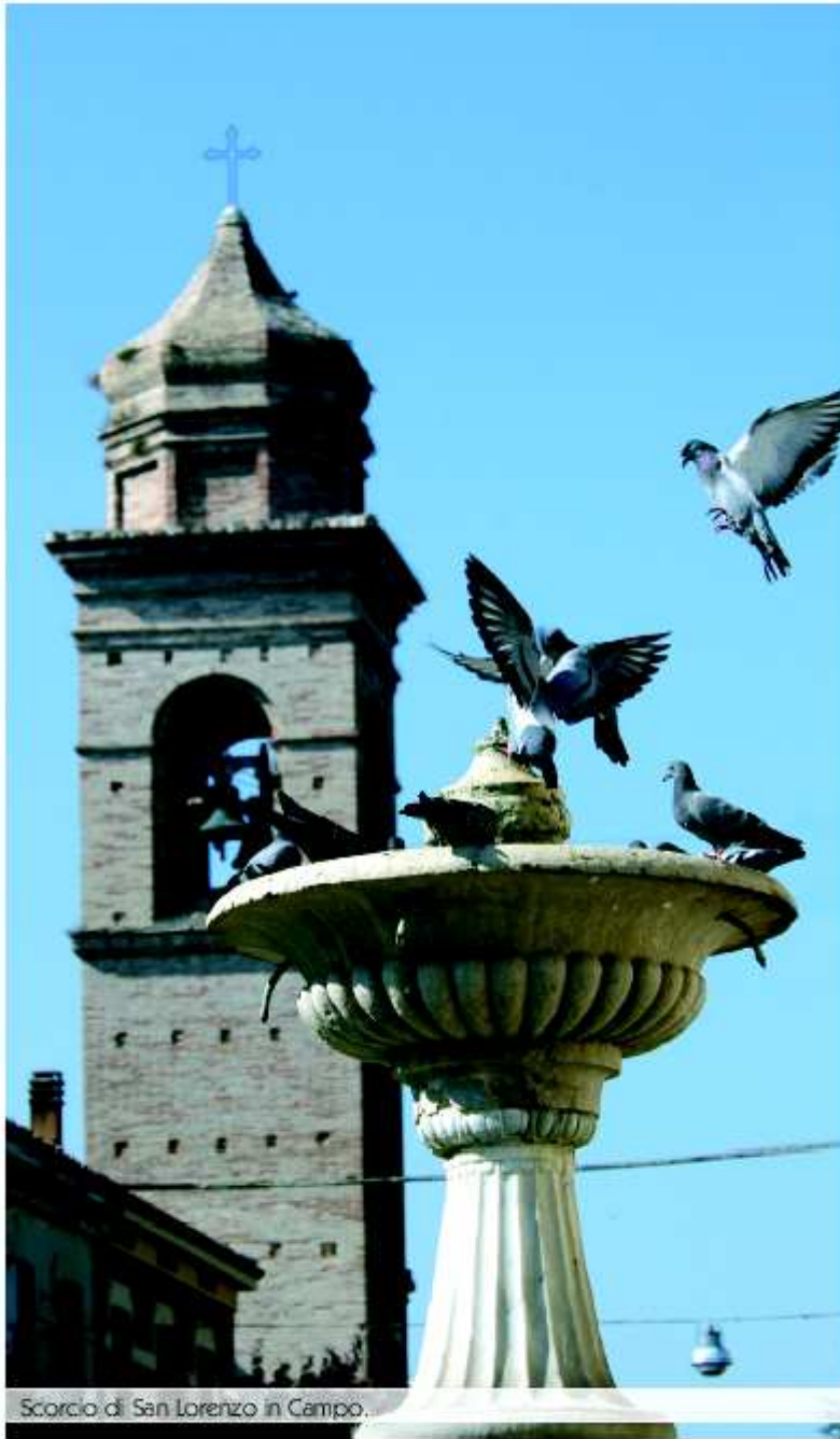
Scorcio di San Lorenzo in Campo.