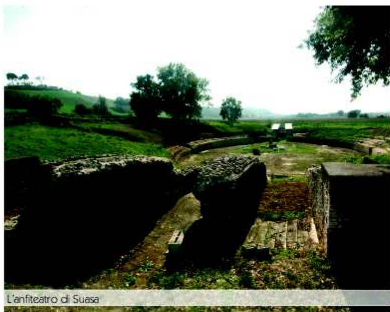
L'anfiteatro di Suasa

È dotata di un proprio quartiere termale e nella parte orientale di un grande giardino porticato solo in parte riportato alla luce. Il ritrovamento di una base iscritta all'interno della piscina del quartiere termale consente di attribuirne la proprietà, almeno per il I e II secolo d.C. alla gens Coedia , una famiglia di rango senatorio. La domus presenta una copertura musiva di pregevole fattura. Di fronte alla domus dei Coedii , sul lato opposto della strada, si trova il foro della città. Si tratta di un grande complesso a carattere pubblico, costituito da una vasta piazza (m 90x45,50) chiusa su tre lati da un portico a pilastri sul quale affacciava una serie omogenea di ambienti, verosimilmente destinati a uso commerciale e artigianale ( tabernae ). Il fronte strada era delimitato da un muro nel quale si aprivano tre ingressi. Un altro ingresso monumentale si aveva anche al centro del portico occidentale e metteva in comunicazione la piazza centrale con un decumano secondario che correva tangente al muro esterno dell'intero complesso.