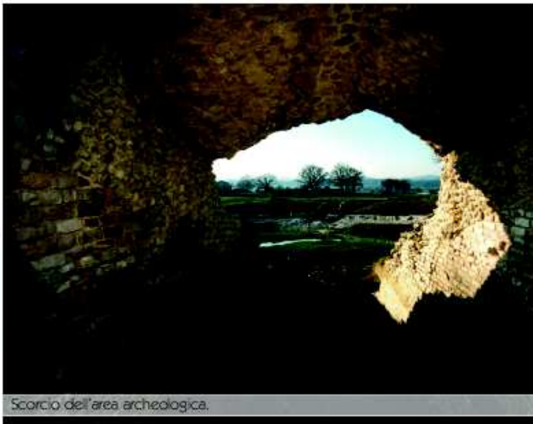
Scorcio dell'area archeologica.

La domus dei Coiedii è una grande abitazione privata situata lungo il principale asse viario della città, in una zona compresa fra il foro e l'anfiteatro. Si tratta di un edificio di notevoli dimensioni (m 103 di