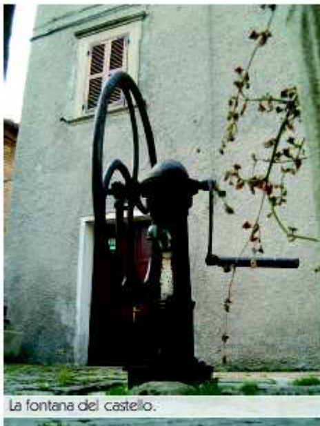
La fontana del castello.