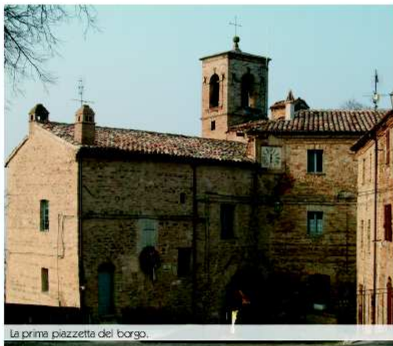
La prima piazzetta del borgo.

Questa valle è punteggiata da centri del genere; basti ricordare Sant'Andrea di Suasa in comune di Mondavio , Montesecco , Monterolo e Montevechio in quello di Pergola . Sono agglomerati di case posti sulla sommità di un podio incamiciato da cortine murarie parecchio alte (ma anche la stessa blasonata Mondavio , fatte le dovute proporzioni, è simile a questi borghetti).