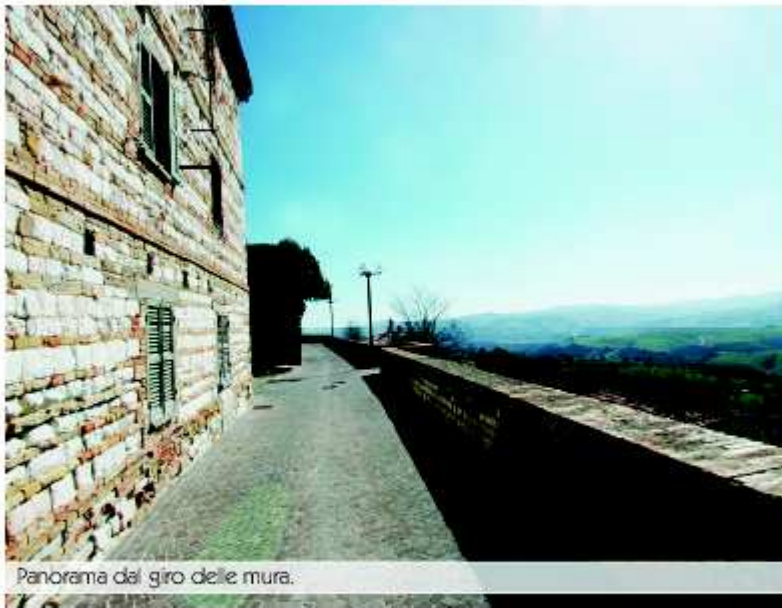
Panorama dal giro delle mura.

Sul finire del secolo, proprio per volere del conte, viene abbattuta la rocca di Montefelcino per ricavare materiale da costruzione per il risarcimento delle mura di cinta e di una chiesa. Quando il prode conte Fabio morì, la cittadina cadde nello sgomento ed il castello tornò