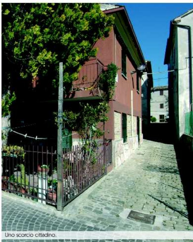
Uno scorcio cittadino.

Il Palazzo del Feudatario di Montefelcino dovette essere edificato nella seconda metà del '500, probabilmente proprio per volere del conte Fabio . Si tratta ovviamente della costruzione che, più di ogni altra, caratterizza l'abitato di Montefelcino . Nei pressi del palazzo si trova la parrocchiale di San Giacomo e San Cristoforo edificata negli ultimi secoli del medioevo. Il senso di Montefelcino è dato dai suoi scorci che così tanto impreziosiscono il tessuto urbano, fino a renderlo una perfetta coincidenza di passato e presente.