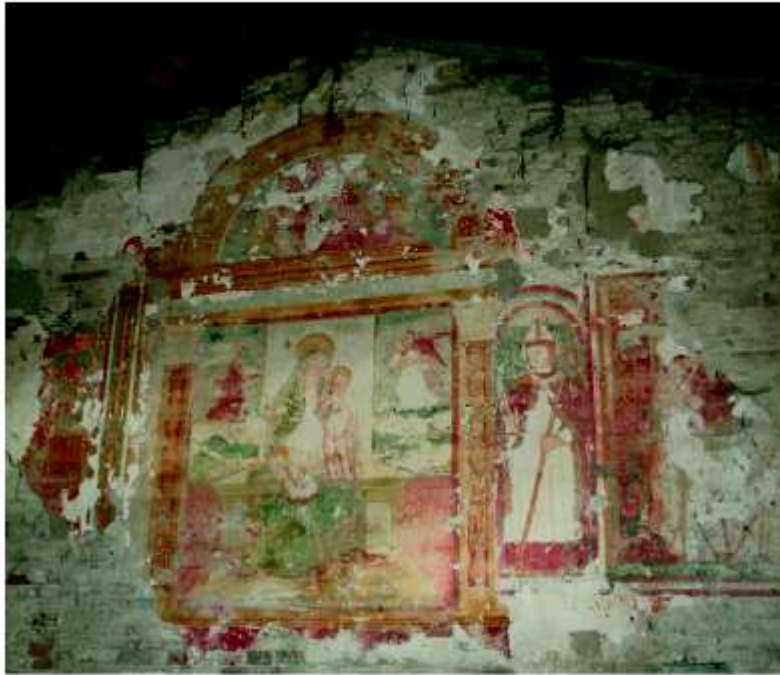
Gli affreschi di Santa Maria.