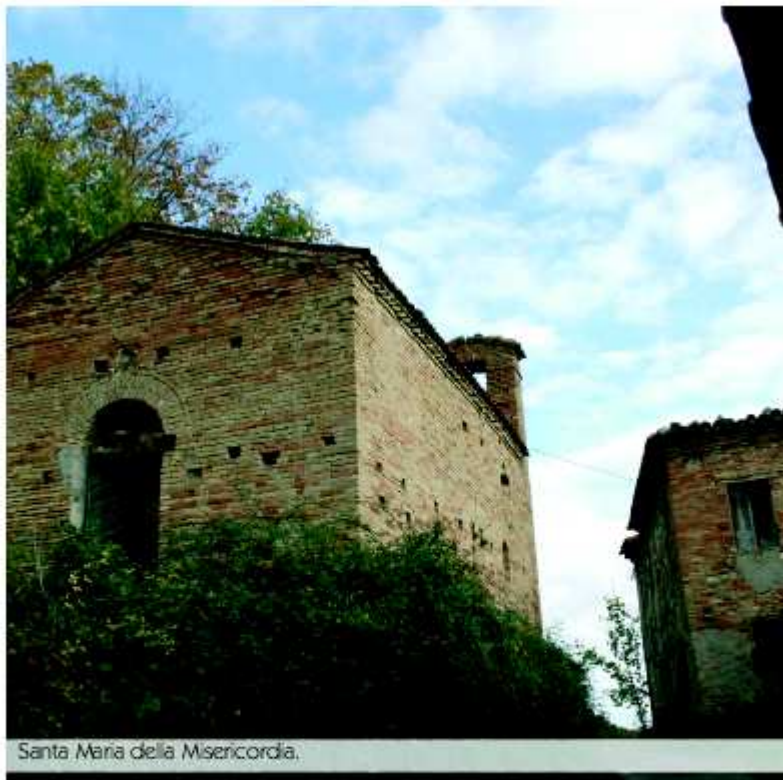
Santa Maria della Misericordia.

La chiesa ha ora un tetto nuovo, ma gli affreschi attendono un intervento di recupero. Per ora è bello godersela così. Povera, esterior-