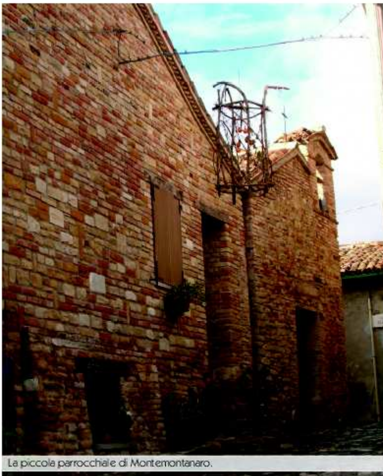
La piccola parrocchiale di Montemontanaro.

M ontemontanaro (325 m s.l.m.) è il primo borgo che ci accingiamo a visitare. Questa frazione, sino a qualche anno fa, era decisamente a serio rischio di abbandono. Una forte emigrazione aveva interessato il centro, spopolandolo via via in favore dell'area costiera della Valmetauro . Oggi, grazie ad alcuni giovanissimi che hanno deciso di risiedere in questo luogo, il borgo sta letteralmente rinascendo. Diverse abitazioni sono state ristrutturate e