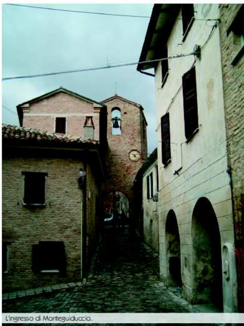
L'ingresso di Monteguiduccio.

Un altro castello molto importante ancora superstite e densamen-