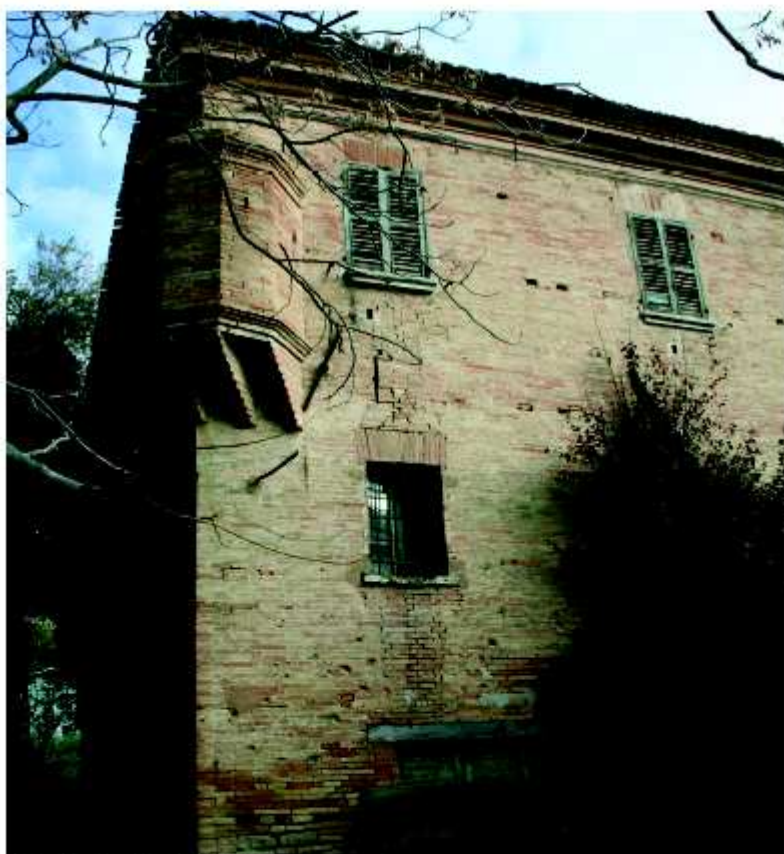
Villa Crescentini, particolare.

Lasciando Montemontanaro in direzione di Fontecorniale , sulla destra, si incontra una grande costruzione in laterizio, una villa che conserva alcune suggestive torrette aggettanti dagli angoli del corpo principale del fabbricato. È Villa Crescentini (di proprietà