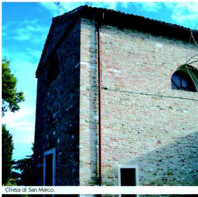
Chiesa di San Marco.

A qualche centinaio di metri dal castello di Montemontano si trova la chiesa di San Marco , di antica costruzione, che, al suo interno, conserva alcune opere d'arte significative. Per i più curiosi, murati nel lato destro dell'edificio, si trovano alcuni frammenti lapidei di fregi di epoca medievale. All'interno è presente un affresco del XV secolo ed una pala d'altare ritenuta opera del Guernieri e datata agli inizi del '600.