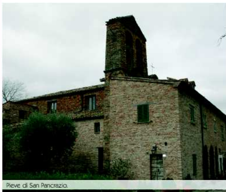
Pieve di San Pancrazio.

Tornando alle porte del capoluogo, proprio lungo la via che da Montefelcino discende verso la piana del Metauro , si trova il borghetto delle Ville , con l'omonima chiesetta. A poche centinaia di metri da questa, sulla vetta di un colle, è collocata la chiesa di San Severo del XVIII secolo. Al di sotto dell'abside si trova una grotta con pilastri ad arco; di qui origina anche un ampio cunicolo, scavato nel suolo tufaceo come nel caso di Monteguiduccio , sul quale si aprono cinque nicchie. In questa chiesa, il 24 gennaio, si festeggia la ricorrenza del patrono cittadino Sant'Esuperanzio .