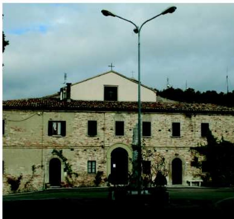
Fontecomiale, chiesa di Santa Barbara.

La chiesina, ad aula unica, di proprietà privata, è dedicata a Santa Maria della Misericordia , dedica molto diffusa nei secoli medievali.