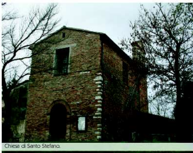
Chiesa di Santo Stefano.

Nei pressi di Monteguiduccio si trova la frazione di Casa Rotonda dove è presente la chiesa di Santo Stefano . Sebbene antica, questa