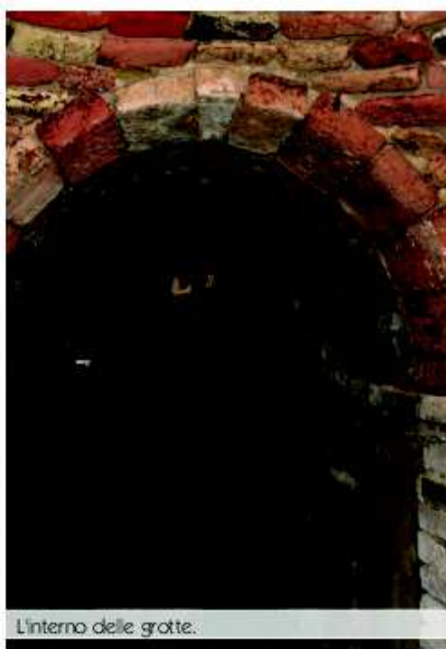
L'interno delle grotte.