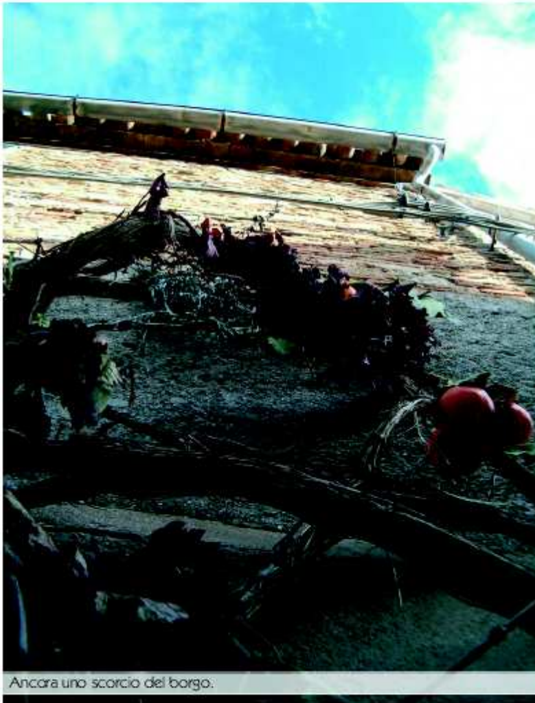
Ancora uno scorcio del borgo.

Le abitazioni sono in pietra a vista e laterizio. Ovviamente, come nei borghi circostanti, è l'arenaria che domina la tessitura litica delle case. Passeggiando per il corso principale, lastricato in pietra, con il rischio quasi di non notarla, sulla sinistra, compare la piccola chiesa parrocchiale cittadina, dedicata a San Michele . È una piccola perla, con