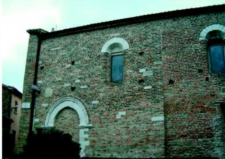
La chiesa di San Giovanni.

te abitato, questa volta, perso nel territorio di Montefalcino è Monteguiduccio .