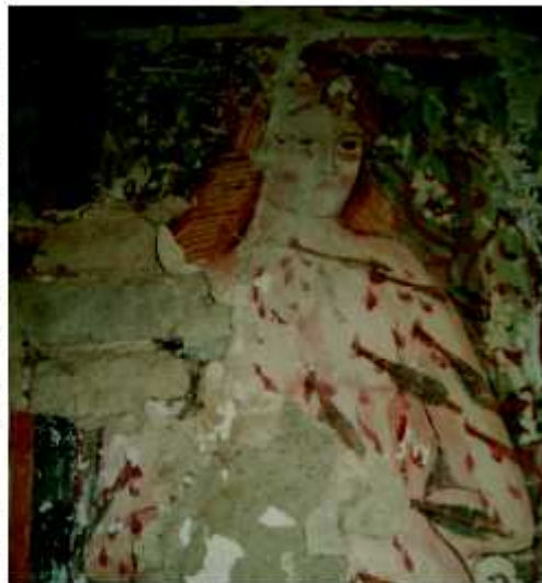
San Sebastiano, particolare.