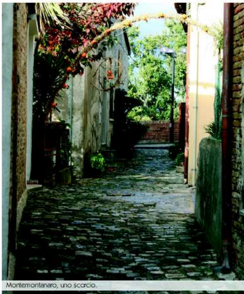
Montemontanaro, uno scorcio.

Il borgo è racchiuso tra le mura in terracotta che hanno mantenuto dignità comunale sino al 1868, quando questo luogo venne accor-