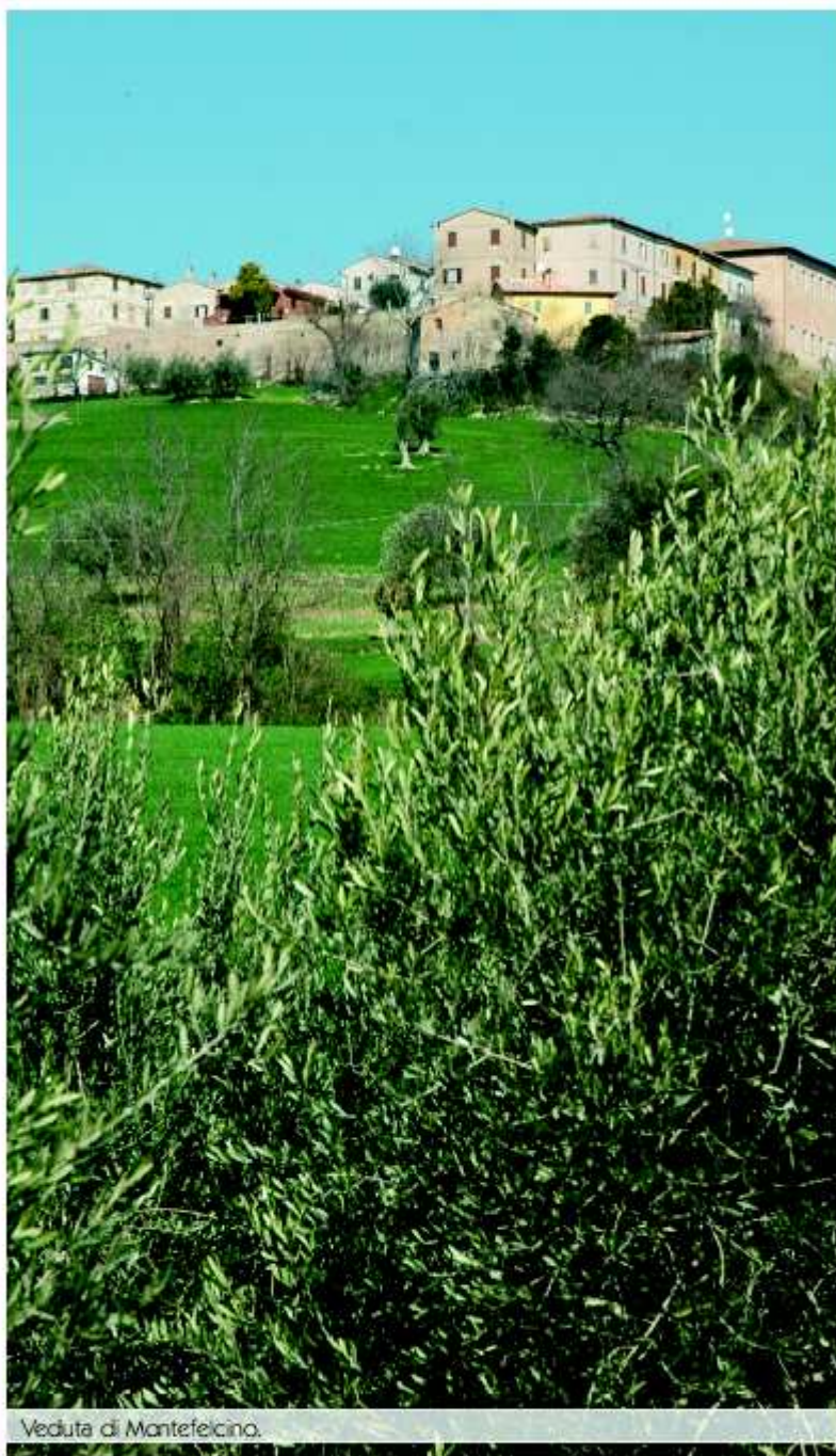
Veduta di Montefelcino.