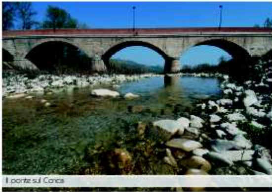
I ponti sul Conca

Lungo il corso del Conca trovavano, ovviamente, ragione d'essere innumerevoli mulini dove la popolazione si recava a macinare le granaglie per ricevere, in cambio, farina per la panificazione. La leggenda registra almeno un centinaio di mulini, da Morre Bozzine di Monte Copio