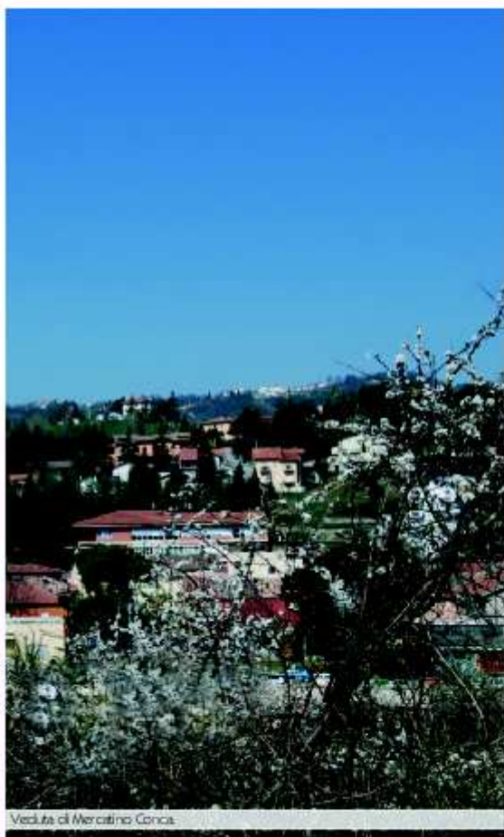
Veduta di Mercatino Conca.