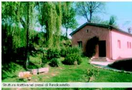
Struttura ricettiva nei pressi di Randicastello.

Monte Altavellio , nel medioevo, era castello con una torre e 25 famiglie residenti. Le sua chiesa dedicata a Santa Maria si trovava (come quelle vicine) nella diocesi di Montefeltro , nel plebato di Pieve Coena . E nei dintorni della frazione era presente una casa per i pellegrini, dedicata a Sant'Egidio , presso la scomparsa località di Sera degli Olmi .