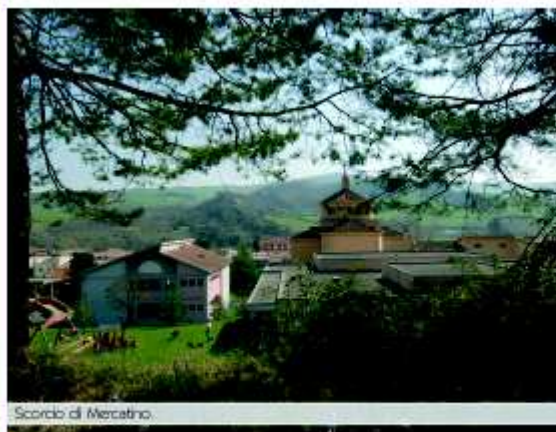
Scorcio di Mercatino.