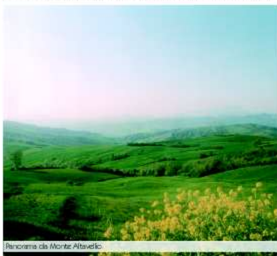
Panorama da Monte Altavello

Un tempo, racconta la tradizione popolare, proprio in questo tratto del corso d'acqua, alcuni cittadini di Mercatino tentavano la fortuna pas-