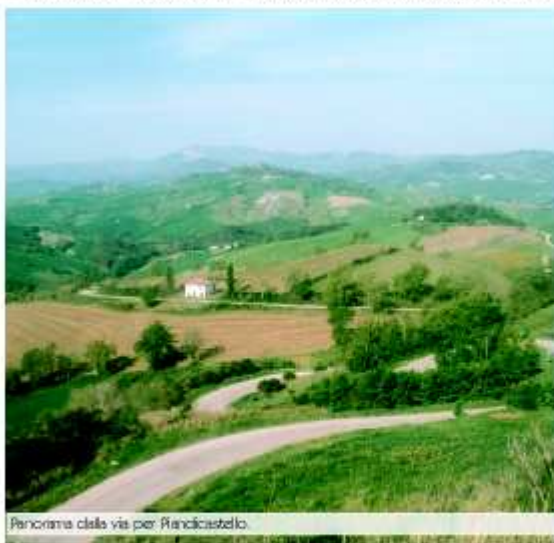
Paesaggio dalla via per Piandicastello.

Questo piccolo agglomerato di case, che pare non dimostri traccia della sua antichità, alto su un terrazzo aperto alla sottostante vallata, nel XIII secolo apparteneva a Buonconte di Montecitro e qui, tra medioevo e rinascimento, vi risiedevano una quindicina di famiglie il cui unico