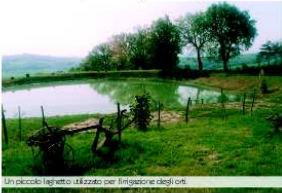
Un piccolo laghetto utilizzato per l'irrigazione degli orti.

Da Monte Alavellio è possibile imboccare, sulla sinistra, una strada che conduce alla frazione di Piandicastello . Scende un poco ora, la via, e si continua tra le ginestre sulla cresta di un crinale suggestivo, circondato da calanchi. È affascinante questo tratto del comune di Mercatino . Qui non c'è veramente nulla, se non campagna, vento ed una vista incredibile che difficilmente si riesce a descrivere. Sospesi tra le vallate del Conca e del Foggia è soltanto possibile assaporare, in silenzio, la