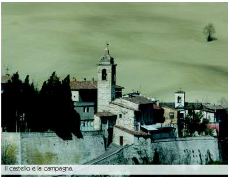
Il castello e la campagna.

Il castello aveva dimensioni notevoli. Interamente circondato da