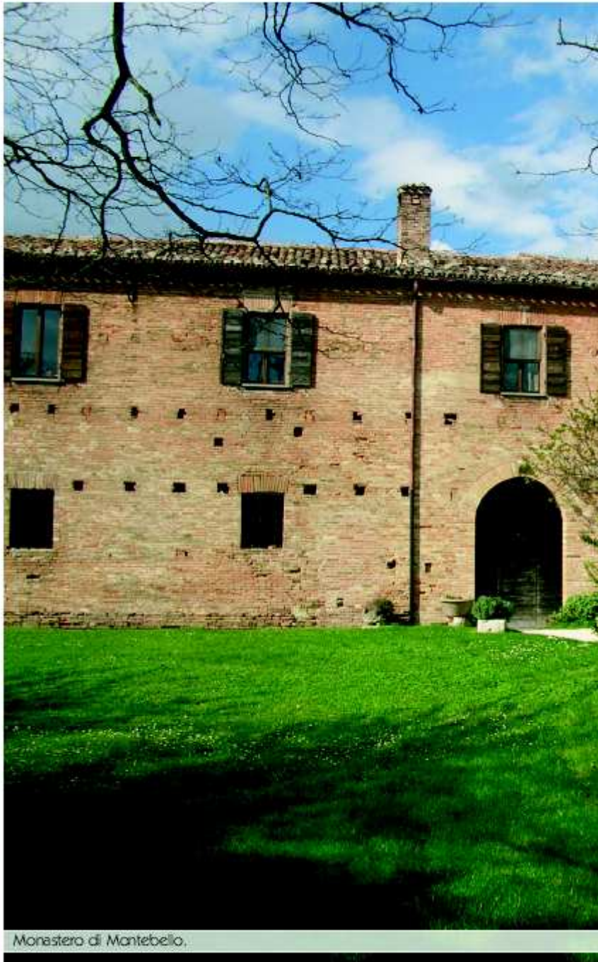
Monastero di Mantebello.