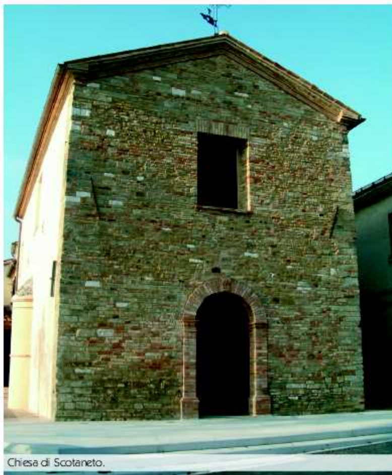
Chiesa di Scotaneto.

I l piccolo territorio di Isola del Piano , sospeso tra la piana del Metauro ed i boschi delle Cesane , compreso tra Urbino e Fossombrone , conserva alcune storiche frazioni che meritano d'esser visitate, magari in passeggiata o utilizzando un mezzo di trasporto meno invasivo di auto e motociclette. Pare un itinerario ideale infatti per le due ruote non motorizzate. La bicicletta potrebbe rendere questo paesaggio ancora più suggestivo lasciando percepire gli odori della