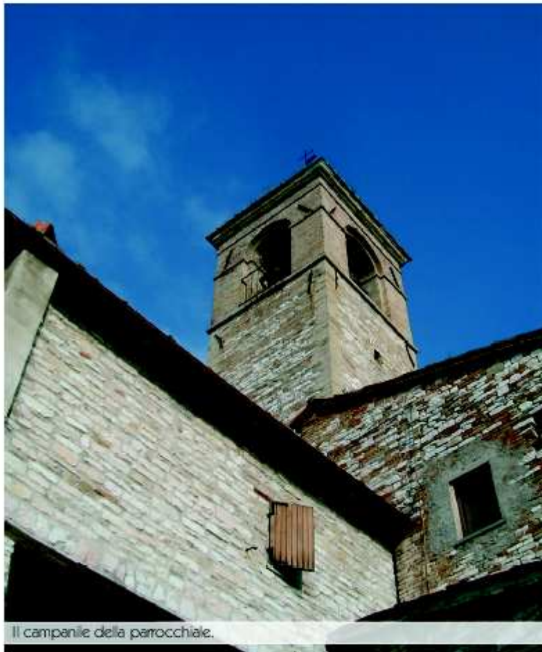
Il campanile della parrocchiale.

È un territorio di frontiera questo, tra due città altezzose che, nei secoli del medioevo, si contesero la zona. A pochi passi dalla modesta Isola sorgono le città di Fossombrone ed Urbino , con il loro traboccante carico di storia. Tra queste due torri di superbia se ne sta la piccola Isola con i gomiti alti, per difendere il suo piccolo orto. Un orto prezioso, dove l'acqua e la terra si uniscono, da secoli, rendendo fiorente un paesaggio movimentato di poggi.