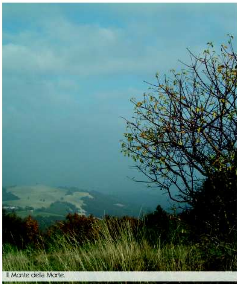
Il Monte della Morte.

Ed invece sotto le mura di Castelgagliardo , ammirando queste