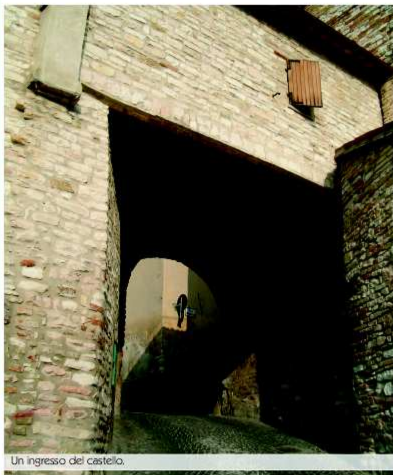
Un ingresso del castello.

Il senso di Isola oggi è legato alla genuinità dei prodotti che la sua campagna dona a chi riesce a coltivarla con sapienza antica. Questa terra è posta quasi interamente sotto un regime di agricoltura biologica che rende il territorio sapientemente curato. Ed allora dai monti