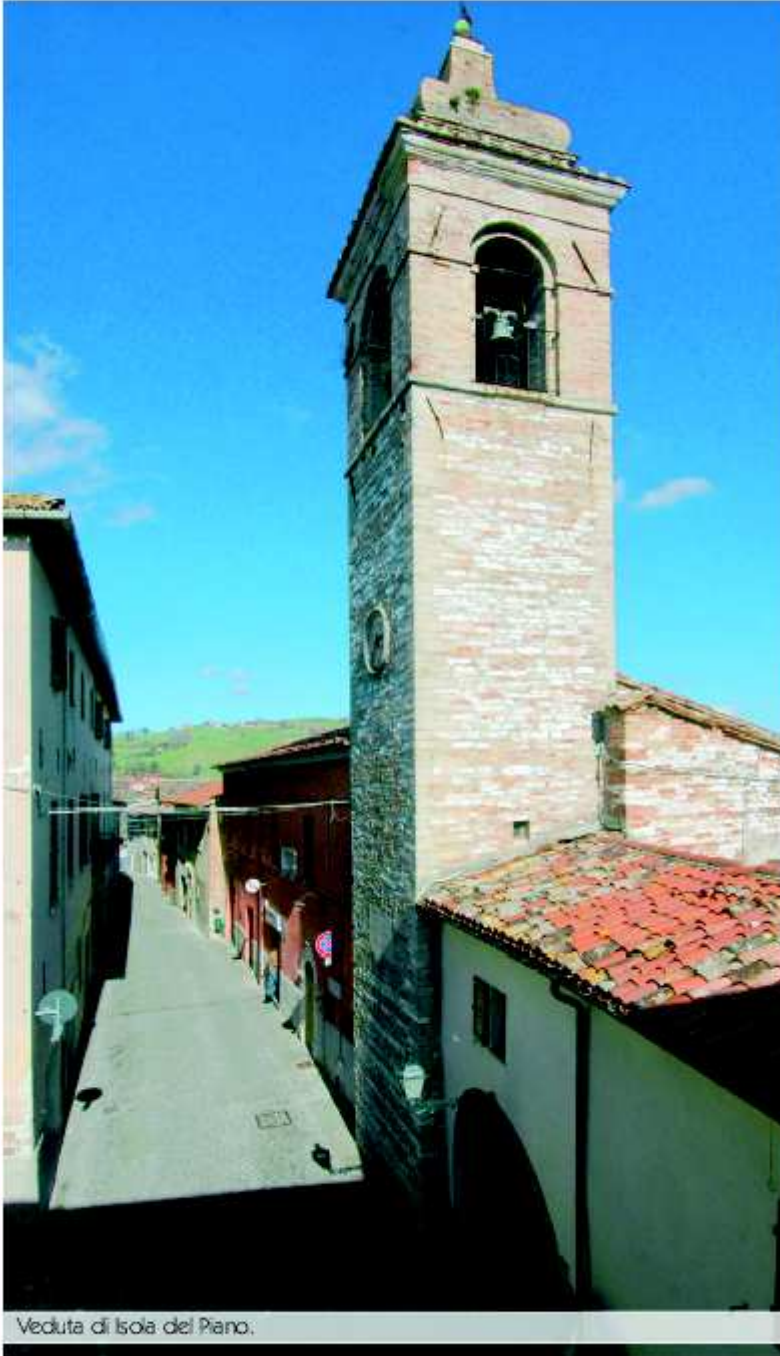
Veduta di Isola del Piano.