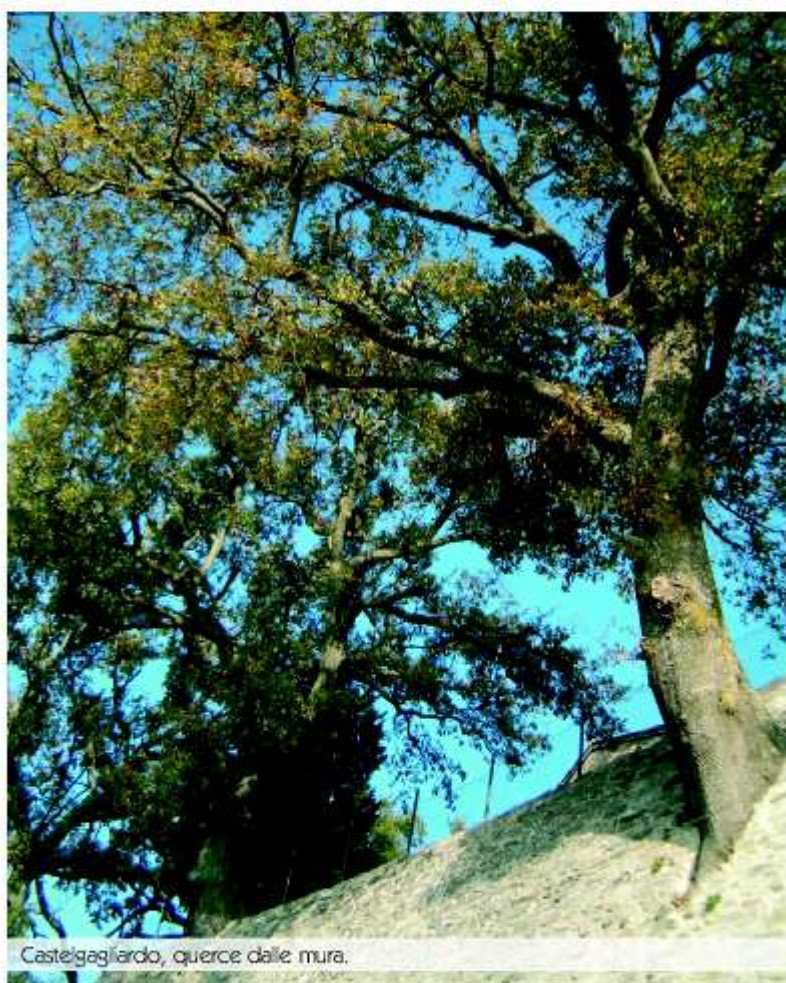
Castelgagliardo, querce dalle mura.

Vieni da pensare che se da queste parti fosse passato il prode Don Quijote de la Mancha (cavaliere che scambiava mulini a vento per giganti, immaginario parto del genio spagnolo di Cervantes ), questi avrebbe scambiato Castelgagliardo per un enorme ragno, piantato sulla cima di un colle, dal corpo compatto e dalle tante zampette pronte a catturare prede per poi inghiottirle in un mondo fantastico.