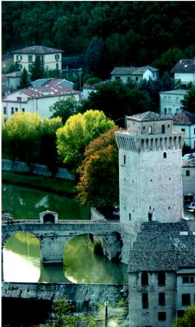
Veduta di Ferrignano.