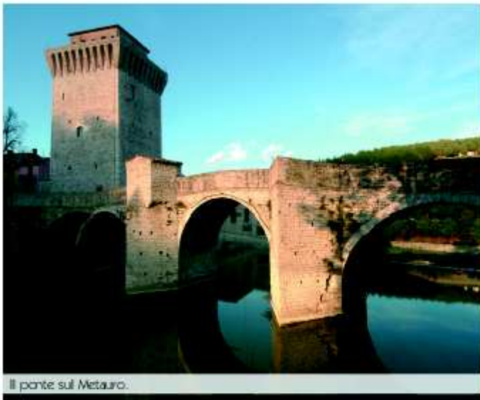
Il ponte sul Metauro.

Per raggiungere questa cittadina, passando dunque da Urbino , occorre scendere. Ci si tuffa letteralmente giù per colline i cui contorni sono ancora visibili in antichi affreschi del '300, ma anche in quelli di Piero della Francesca . Picchia forte verso il basso la strada. Dai colli che sostengono la città ducale ci si sta dirigendo, infatti, verso una piana. Una piana che, se potesse magicamente parlare, riferirebbe di aspri scontri, svagati letterati e borghesi industriosi indaffarati tra le filande ed i mulini della vallata.