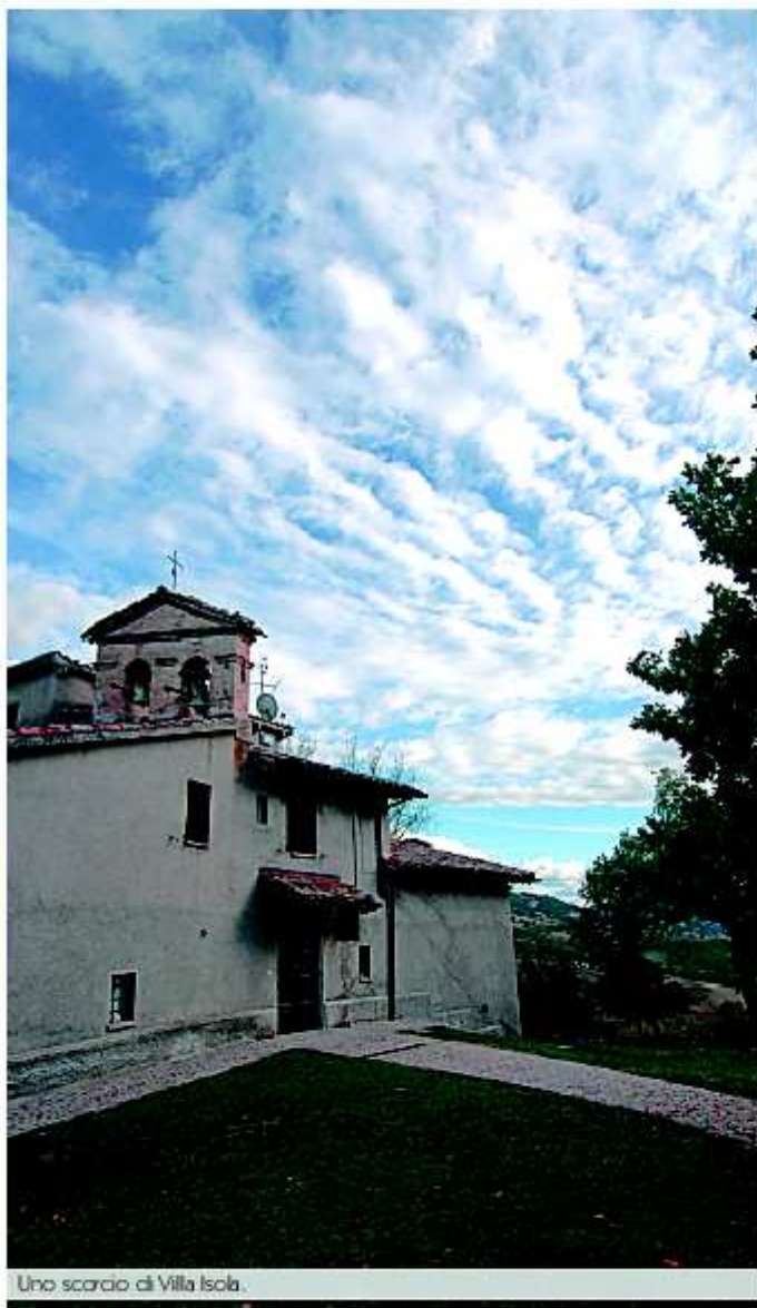
Uno scorcio di Villa Isola.