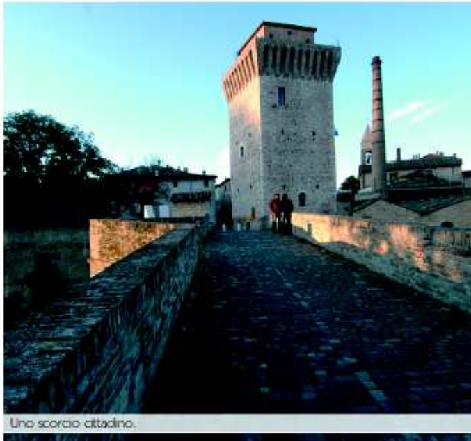
Uno scorcio cittadino.

Da borghetto sorto attorno ad un ponte Famignano divenne presto il più importante polo manifatturiero del Ducato . La vera forza di questo centro era, ovviamente, l'energia che derivava dal suo fiume. Grazie ad esso i mulini riuscivano a macinare i grani dei Duchi , le gualchiere follavano panni a tutto regime e tutto ciò portava in riva al fiume denaro e ricchezza. Lo scorrere dei secoli ha voluto mantenere questo senso di polo industriale ante litteram testimoniato oggi dallo